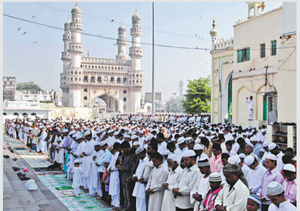
▲11月7日，在印度城市海得拉巴，穆斯林在當地著名的參加清真寺參加祈禱儀式

【本報訊】據中通社8日消息：印度北部北安查爾邦的宗教聖地赫里德瓦爾8日在舉行宗教活動時發生踩踏事件，目前事故已造成至少16人死亡，46人嚴重受傷。據印度媒體報道，踩踏事件發生時，數萬名宗教信徒正在參加一個宗教儀式，擁擠的人群在向聖火拜祭時有人跌倒而引發踩踏。當地一名官員稱：「截至目前為止，踩踏事件已經造成14名女性、2名男性死亡，另有46人嚴重受傷。」該官員說，導致踩踏事件發生的原因是信徒數量太多，超過了承載能力。赫里德瓦爾位於恒河從高原進入平原處，是重要的朝拜聖地。活動組織方原來預計此次計劃持續5天的宗教活動將吸引500萬人參加。