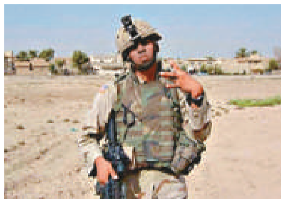
▲一名美軍士兵作出黑幫標誌性手勢

據悉，美國的幫派成員在獲取及購買武器方面手段日趨複雜，使得執法人員在追蹤武器來源時難上加難。報告指出，有入伍軍人為黑幫成員所利用，作為武器供應方。2010年11月，三名美國海軍士兵在洛杉磯被捕，被指控曾向13名幫派成員非法出售武器。