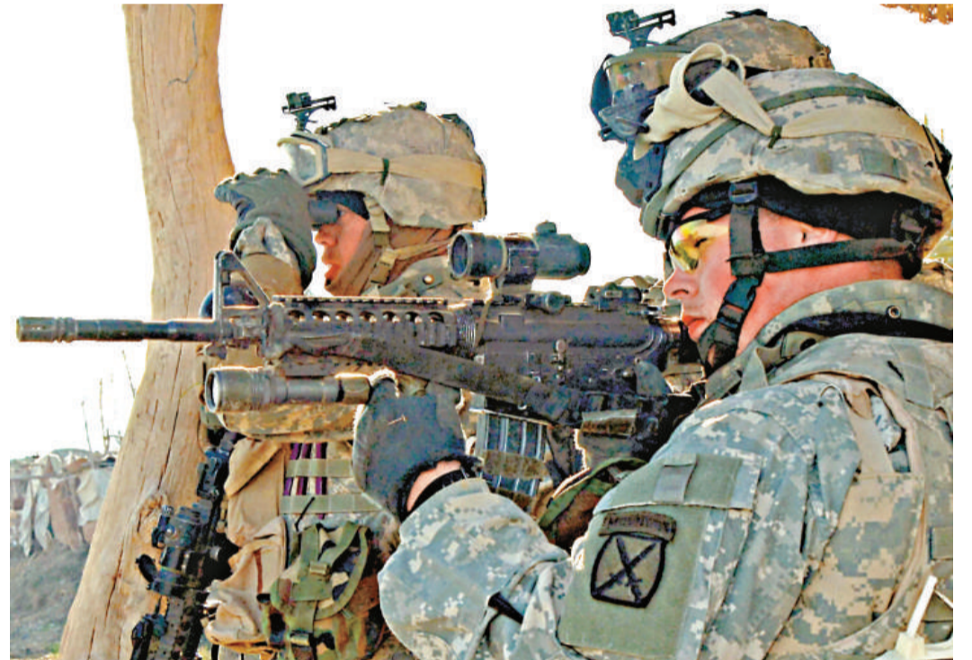
▲報告指美國黑幫組織盯上了軍隊的配給武器而有意滲透美軍

而受過軍事訓練的黑幫成員，顯然對執法人員構成特別威脅，因為他們擁有特殊武器，以及作戰訓練技巧，此外他們還會把這些技巧傳授給其他黑幫成員。