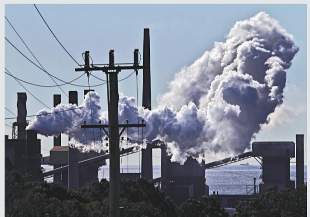
▲澳洲肯布拉港一間鋼鐵廠排出大量廢氣

上議院以36票對32票，通過執政工黨提出的清潔能源法案，開徵碳排放稅。當天的表決為歷時5年的有關關稅法激烈辯論畫上了句號。下議院在上月已表決通過這項法案。根據法案，澳洲大約500間高碳排放企業，由明年7月起，要繳交碳排放稅。根據相關安排，2012至13年度，碳排放稅是每噸23澳元，隨後三年將每年遞增大約2.5%。環保人士普遍支持這個碳排放稅法案，支持法案的民眾看到這項法案通過後鼓掌歡呼。但也有大批民眾反對當局徵收碳排放稅。反對黨人士說，當局徵收碳排放稅將造成失業，並使生活費上升。