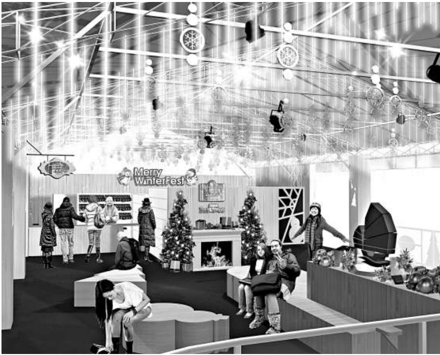
▲冬日節的冰紛樂園

旅發局共投資三千九百萬元於「繽紛冬日節」，較去年增加一成，當中二千六百萬用於推廣。今年的兩大亮點，其一是位於尖東的「冰紛樂園」，百周年紀念花園將化身戶外真雪溜冰場，入場費全免，只需付十五至三十元的溜冰鞋租金即可暢溜一小時。屆時還可體驗真雪「飄雪」，及欣賞以聖誕節人物