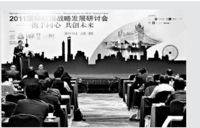
▲國際航運戰略發展研討會「立冬」日召開，業界卻早已感到市場寒冷

1999年，斯特納引入「V-Max」系列油輪，該款船吃水淺，但卻可運載約200萬桶原油(相當於超級油輪的容量)。過去12年「Max」系列概念被運用在多款油輪船隻，其中包括AirMax的實驗工具——成品油船「P-Max」型。