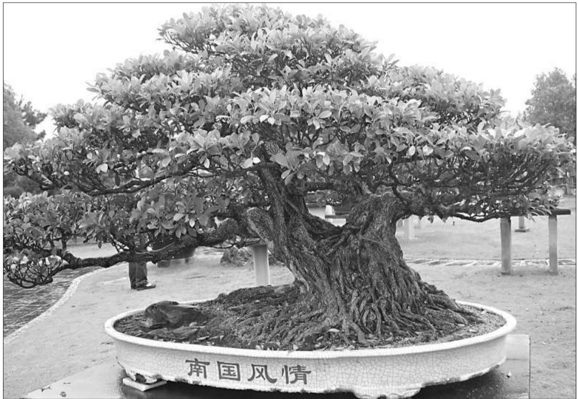
南國風情 鮑家花園鎮園之寶