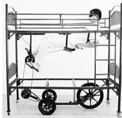
▼黃國才的作品《夢遊號》以「碌架床」為主體，「碌架床」亦被大會用作展示展品的載體