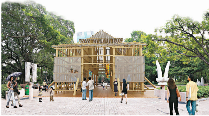
▲香港建築師林偉而將在九龍公園搭建「Bamboo Structure Pavilion」（竹棚結構亭）

深圳方面的雙年展將於十二月七日至明年二月十八日舉行，港深兩地在本年底至明年年初都有合作及交流活動；而香港方面的展覽由香港建築師學會、香港規劃師學會及香港設計師協會共同舉辦，將於明年二月十五日至四月二十三日，在九龍公園及香港文物探知館舉行，目標觀眾人次約七萬人。雙年展網站是 http://www.hkszbiennale.org 。