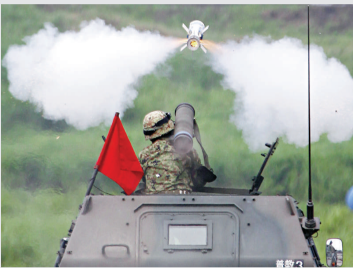
▲一名日本自衛隊員8月參加在東京附近舉行的實彈演習

防衛計劃大綱並指出為加強西南群島的防衛，光靠日本自衛隊仍不夠，應思考活用民間及美軍的運輸能力。防衛政策的「重點區域」是首都圈都市，及從鹿兒島到沖繩縣間的西南群島。有關島嶼防衛角色，定位為「先發制敵，阻止侵略」。