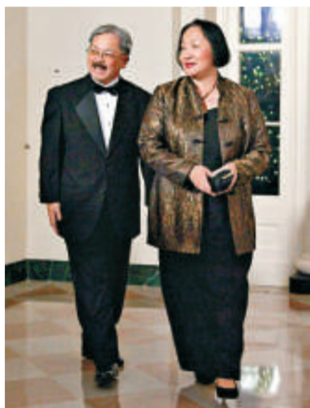
▲三藩市新任市長李孟賢（左）與奧克蘭市長關麗珍

奧克蘭市華裔女市長關麗珍聽到李孟賢當選的消息後十分興奮。她表示，一百多年來，華裔移民來美國奮鬥，經過無數考驗，終於能夠團結起來。她祝賀李孟賢成為三藩市第一位民選華裔市長，相信這是歷史上值得紀念的一天。