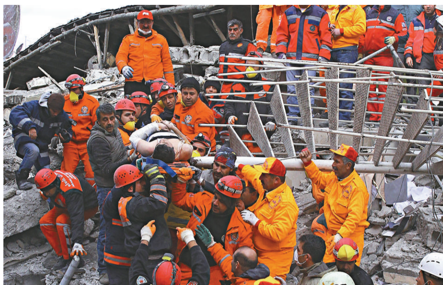
▲土耳其救援人員10日自倒塌的酒店內救出被困人員

凡城東北部曾於10月23日發生7.6級大地震，之後又發生數百餘餘震，現時仍有數千人住在帳篷裡，忍受嚴寒。土耳其是地震頻發區，幾乎每天都有小地震。在1999年西部兩次大地震中，共有約2萬人死亡。