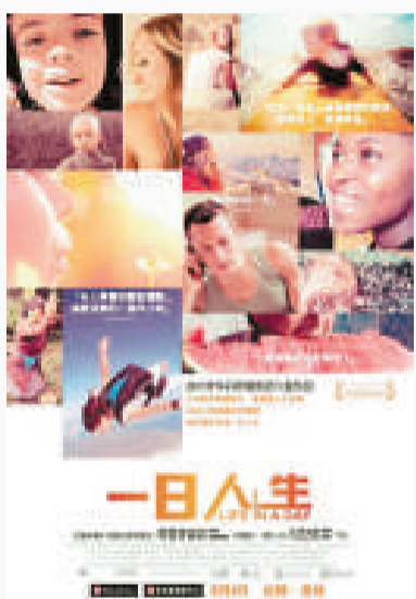
▲《一日人生》港版電影海报

今年8月，電影在香港上映，上周一，YouTube 在網站上發布了該片，現時可免費收看。