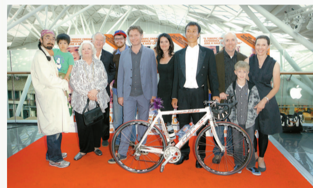
▲在《一日人生》演出的部分活動參與者獲選出席今年6月在英國舉行的電影首映禮

計劃，號召世界各地的人上載他們在7月24日這天拍下的10分鐘生活短片，再將這些短片集結成一部電影。計劃創意來自市場部職員的突發奇想，「告訴我們你的故事，說出你的恐懼，讓我們看看你口袋中有什麼。」（Tell us your story, tell us what you fear and show us what you have in your pockets.）一句簡單的口號，令網站最終收到來自192個國家和地區的8萬條短片，總長達4500多小時。