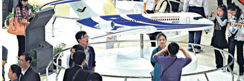
▲中國製造業逐漸向高端技術方向發展

國家統計局數據顯示，1978年，中國經濟對世界經濟增長的拉動為0.1%，而同期美國經濟對世界經濟增長的拉動達到1.7%；到2007年，中國經濟對世界經濟增長的拉動已提高到0.7%，高於所有國家位居第一。2009年，中國對世界經濟增長的貢獻更達到50%。