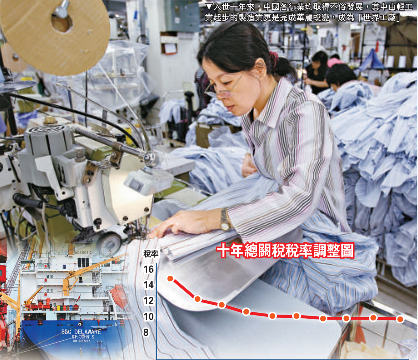
十年總關稅稅率調整圖