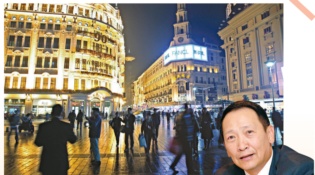
▲圖為上海南京路步行街

入世十年，在中國經濟受益於全球經濟一體化及貿易自由化的同時，中國也為世界經濟發展提供了新的動力，把握「中國機會」將成為大家共同的話題。