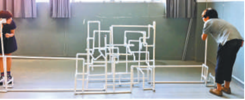
▼鄭傲衡的互動裝置《Distance》