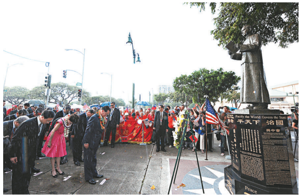
連戰(前排)在夏威夷當地時間10日到檀香山中國城的興中會紀念堂參訪，向孫中山銅像獻花致敬

在演講中連戰表示，孫中山先生在1894年再次來到夏威夷的時候，創立了「興中會」，開啓了中國革命的先聲。這是中國當時第一個國民革命的革命團體。他說，「興中會」建立後，開始了不屈不撓的十次革命，一百年前，在孫中山的領導下，推翻了滿清王朝，終結了封建帝制，建立了亞洲第一個民主共和國。