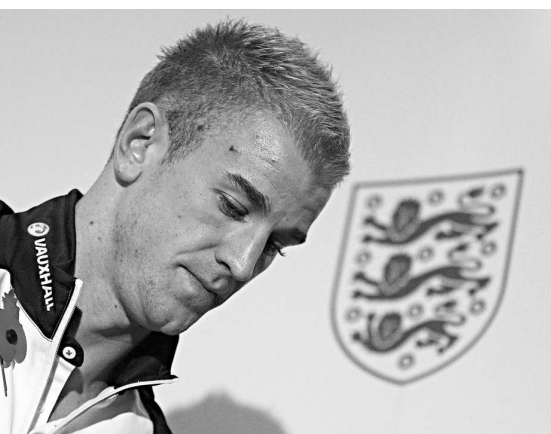
▲英隊門將赫特無懼任何敵手