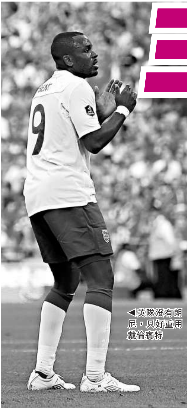
◀英隊沒有朗尼，只好重用戴倫賓特