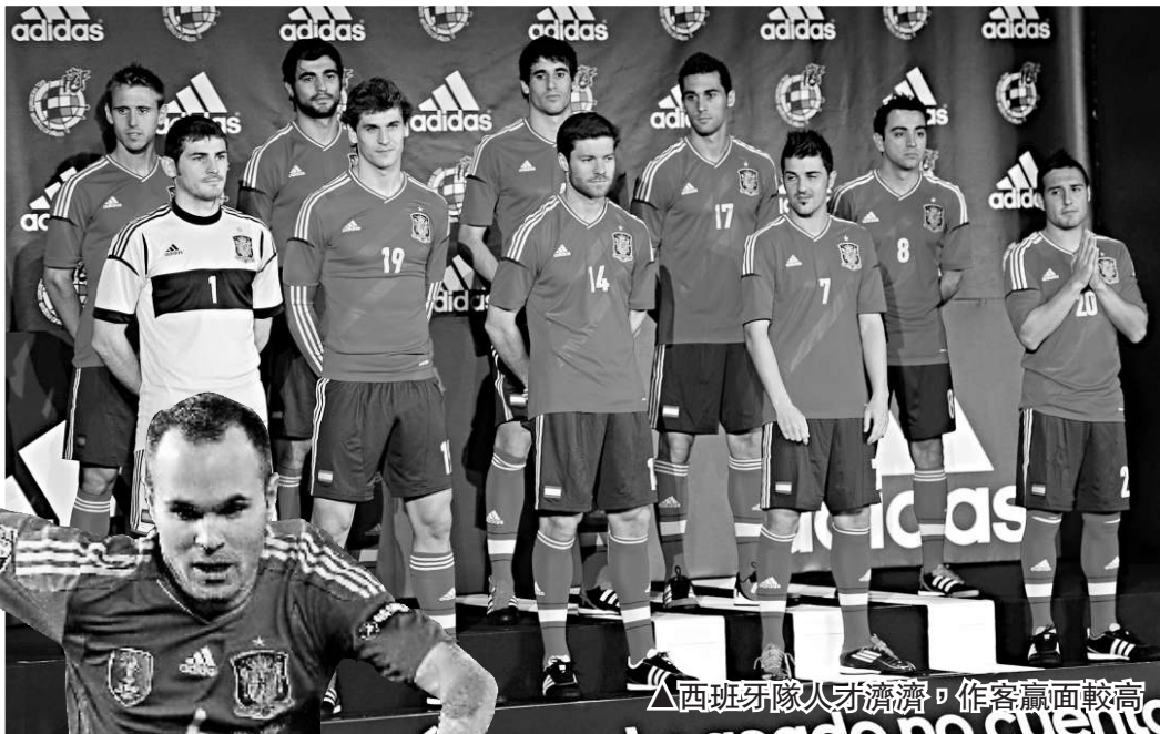
◀西班牙隊人牙濟濟，作客贏面較高