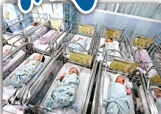
▲大量印尼孕婦選擇在11日誕子