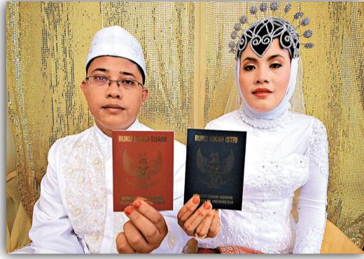
▲印尼新婚夫婦婚禮後合照