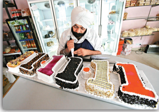
▲印度男子製作「11.11.11」圖案的蛋糕