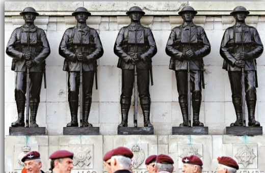
▲英國小鎮皇家伍頓巴西特11日擺出六個1的圖案，紀念退伍軍人日

【本報訊】綜合美國費城新聞網站 philly.com 及《休斯頓紀事報》11日報道：周五是2011年11月11日，這樣6個數字相同的日子百年一遇。信通靈術的人認為，11這個數字具有神秘力量，而三個1碰在一起，可能是非常幸運，也可能是世界末日。