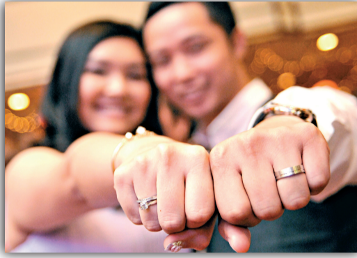
▲馬來西亞新人向人們展示婚戒