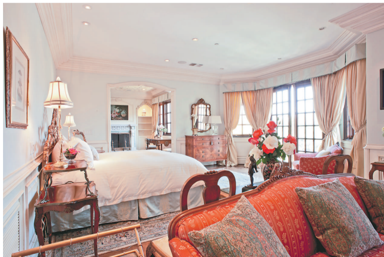
▲米高積遜生前居住及去世時所在的臥室

「好奇」號個頭與小汽車相當，與2004年登陸的火星車「機遇」號和「勇氣」號相比，「好奇」號要長2倍，重5倍多。以核動力驅動的「好奇」號攜帶的探測設備更多、更先進，在火星表面連續行駛能力也更強。按計劃，「好奇」號將於明年8月在火星蓋爾隕坑中心山丘的山腳下著陸，展開為期一個火星年（約687個地球日）的探測，主要任務是查明火星過去或現在是否有適宜生命存在的環境。 根據奧巴馬政府去年公布的新太空戰略，美國將以火星為太空探索的新目的地。美國航天局計劃在2025年後，將太空人運送至低地軌道以外的天體例如小行星，到30年代中期將太空人運送至火星軌道。