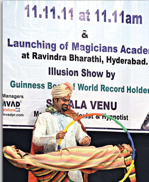
▲印度魔術師11日表演人體漂浮