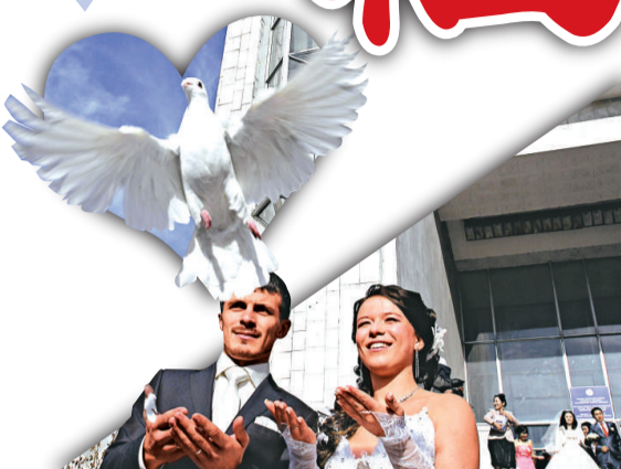
▲比什凱克一對新人放走白鴿慶祝