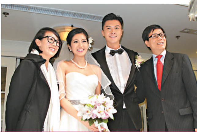
▲陳自瑤下嫁王浩信，心情激動