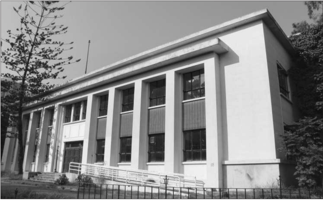
粉嶺裁判法院：新界第一座法院建築

「曉看紅濕處，花重錦官城」，我對巴山蜀水素來有一種特殊的情結。在這個雲淡風輕的日子，我終於邂逅了這座城。在這段短暫的柔軟時光裡，我踏着款款的腳步，行走於美麗迷人的巴蜀山水間，聞着少城巷陌的酒意茗香，追溯着浣花草堂的唐風遺韻，品嘗着天府之國的可人小吃，不知不覺中發現我已愛上了這座城。每座城市都擁有屬於自己的獨家記憶，而擁有三千年歷史的成都，更是將這種深邃的歷史記憶，潛移默化地根植於聲色斑斕的現代文明，創造出歷史傳統與現代文明交相輝映的完美景致，彰顯了錦城深厚大氣的文化底蘊。武侯祠祠論英雄，三國諸葛孔明；寬窄巷子紅城外，少城清風依舊；杜甫草堂浣花溪，唐韻遺風颯颯；