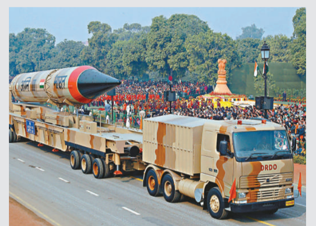
▲印度的烈火-3導彈系統 資料圖片

【本報訊】據中通社15日新德里消息：據外電報道，印度官員15日稱，印度當天試射了一種能攜帶1噸重核彈頭，射程可達中國腹地的遠程導彈，所有參數正常，發射非常成功。