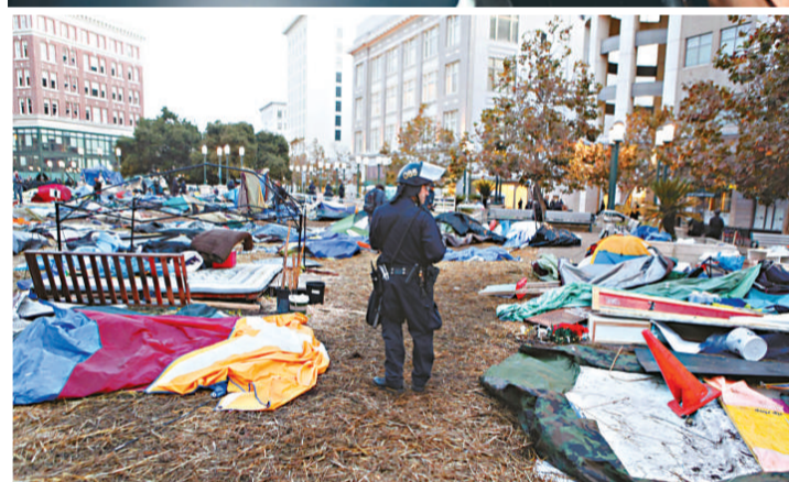
▲「佔領華爾街」示威者14日與警方在祖科蒂公園發生衝突