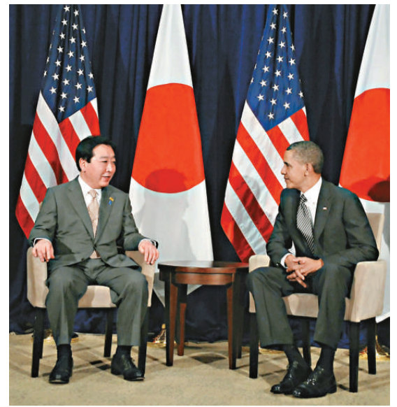
▲日本首相野田佳彥(左)與奧巴馬(右)12日在APEC期間舉行會談

報道評論認為，野田在國內反對意見高漲的形勢下毅然前往夏威夷，但9個談判國卻沒有「敞開臂膀歡迎」。野田滿心希望出席TPP首腦會議，但實際上卻遭到了拒絕。