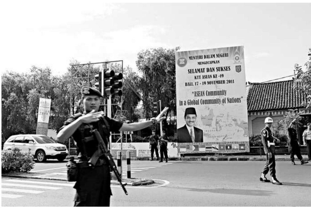
▲中國總理溫家寶、美國總統奧巴馬等重要國家政要將於十七日抵達峇里島出席東亞峰會，當地安保十六日起進一步升級。據稱，當局出動了一萬五千人維持治安。圖為十六日晨通往東盟峰會會場努沙杜阿國際會議中心的路口處大批軍警執勤

報告顯示，中國在八月曾減持美國國債365億美元，並在更早前四個月連續增持美國國債。其他國家中，日本依然以9568億美元的持有量列美國國債的第二大持有國，九月中增持202億美元；英國在九月增持244億美元，以4216億美元總量列第三位。