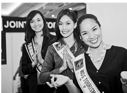
▲在峇里島努沙杜阿會議中心外，三名曾獲印尼旅遊小姐稱號的峰會服務人員合影

文章指出，國際金融危機以來，世界經濟前進的步伐慢了下來。美、日、歐三大傳統發動機相繼熄火，東亞成為世界經濟增長最重要的驅動力。