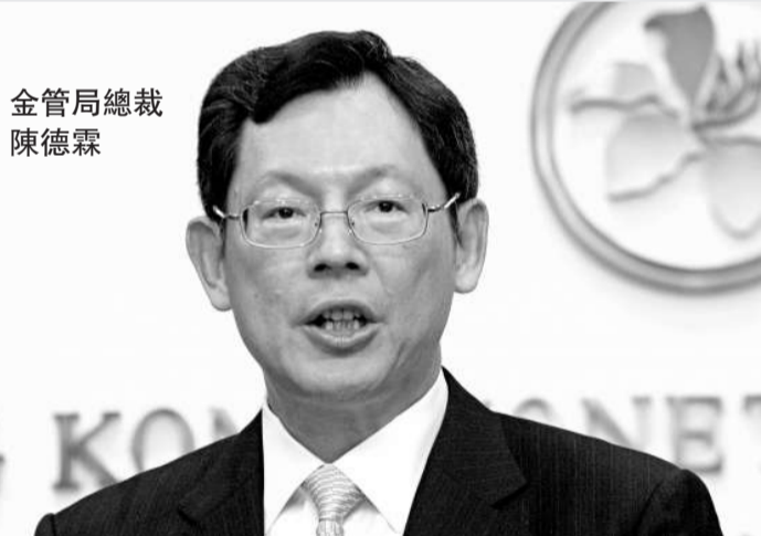
金管局總裁 陳德霖

金管局總裁陳德霖亦指出，歡迎IMF對該局為了加強香港銀行體系的風險管理及穩健程度而採取的逆周期監管措施給予肯定，又指現時外圍環境的不明朗因素不斷增加，當局會繼續保持警覺及審慎，在有需要時會推出適當措施，以維護香港貨幣和銀行體系的穩定。