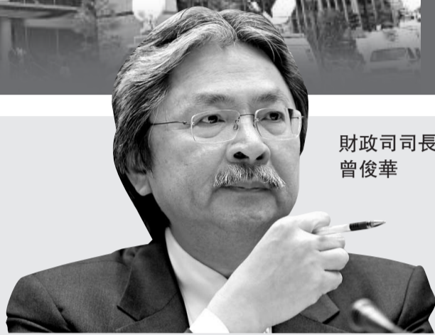
財政司司長 曾俊華

另外，國基會留意到物業及消費價格通脹上升，令市場對聯匯壓力的批評有所增加。寬鬆的貨幣環境無疑令本港經濟周期出現不配合，由於預計聯儲局2013年中前仍會維持利率於極低水平，故本港低息環境可能持續。雖然有聲音提議將港元改與一籃子貨幣掛鈎，但國基會強調改變不會令本港重獲貨幣自主權，反而會犧牲28年努力經營的貨幣及金融穩定。因此，國基會同意聯匯是一個簡單、具公信力、有效而值得繼續支持的匯率制度。