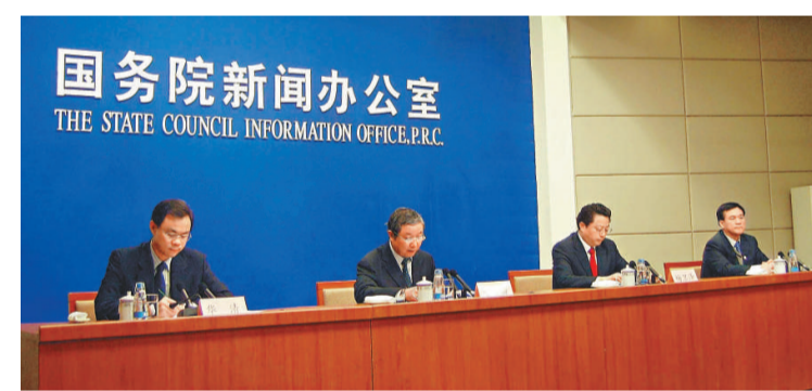
▲國際奧委會副主席于再清(左二)與南京青奧組委會執行主席楊衛澤(左三)等，昨出席青奧會新聞發布會

第二屆夏季青奧會將於2014年8月16日在南京舉行，歷時12天，共有來自205個國家和地區的3000多名14至18歲年輕運動員參加28個大項、216個小項的比賽。