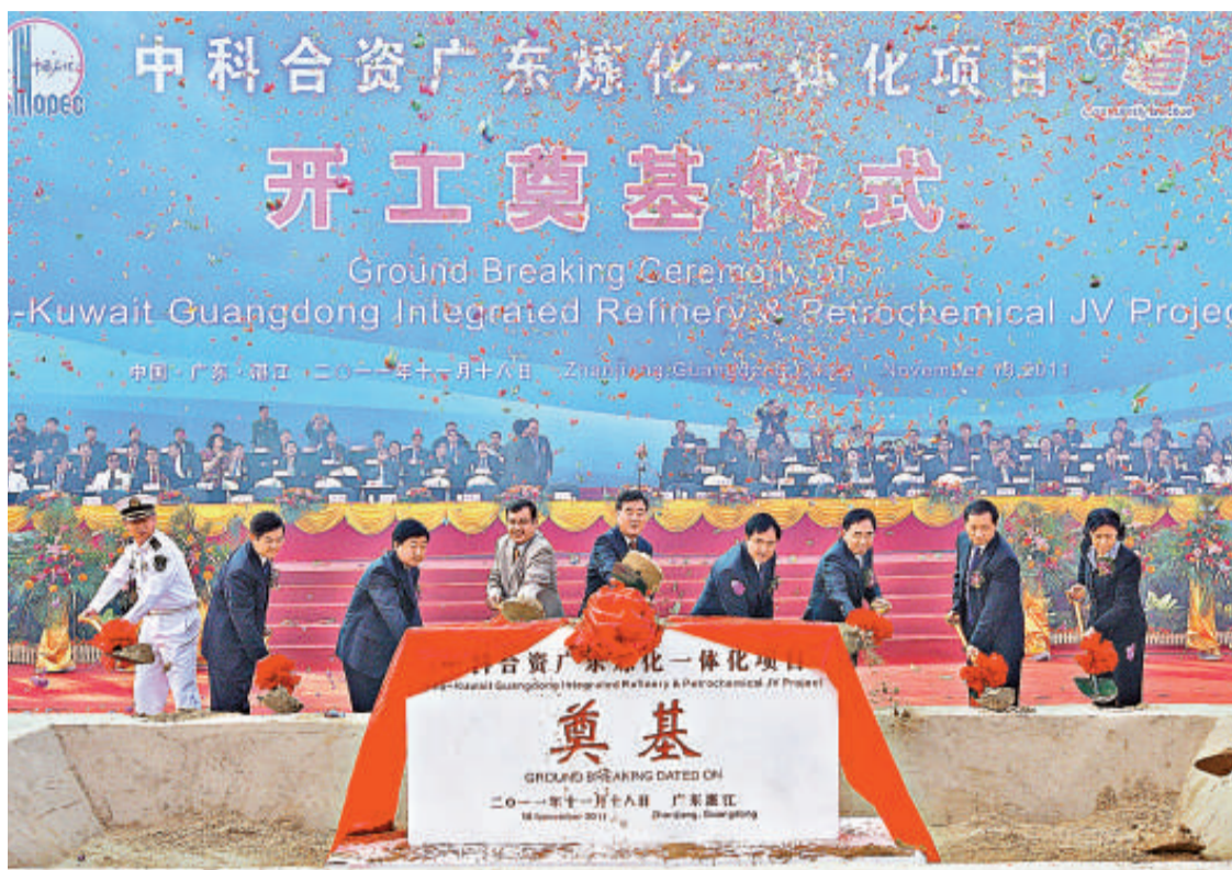
▲十八日，中科煉化一體化項目在湛江東海島開工建設。廣東省委書記汪洋（中）、廣東省代省長朱小丹（右三）等為該項目開工奠基

據悉，由於雖然廣東省政府與上海寶鋼早已簽訂1000萬噸鋼鐵項目協議，但現在項目仍處於審批之中，還未進行有關部委匯簽程序，更未到國家發改委最終審批。