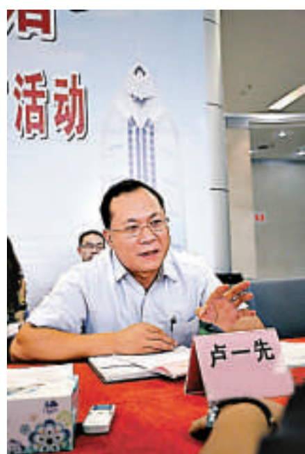
▲現年四十一歲的盧一先是廣州市最年輕的區委書記

【本報記者鄭曼玲廣州十八日電】廣州市領導班子將於今年12月至明年1月換屆，選舉產生新一屆市委、市人大、市政府、市政協領導班子和市委副書記、市檢察院檢察長。目前，組織部門的換屆考察工作已經啓動，在剛剛公示的13名差額考察人選名單中，首次出現了「70後」年輕幹部。