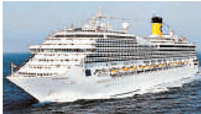
▲歌詩達郵輪填補中國外商獨資郵輪船務空白 資料圖片

從已發布的公示名單看，廣州市領導班子差額考察對象的知識化特點也十分明顯。13人中具有研究生學歷者（包括各級黨校研究生學歷）多達9人。另外，有5人取得碩士學位，