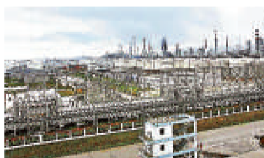
▲中海油惠州煉油項目廠區 資料圖片

不過，在中石化、中海油及中石油在嶺南的競爭中，中石化將繼續穩守華南大本營，並將取得壓倒性的勝利，在未來廣東總計億噸煉化項目中，中石化佔據了約八成的比例。