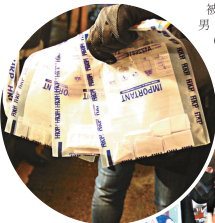
▲警方檢獲的「五仔」及「K仔」毒品

【本報訊】油尖警區探員昨日凌晨突擊搜查尖沙咀金馬倫道一間樓上吧，拘捕五名男女，檢獲「五仔」及「K仔」等毒品，總值近兩萬元。