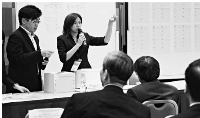
▲ 選舉管理委員會人員為候選人編號進行抽籤

區議會界別首日只有十八人報名，全部來自新界各區議會界別，十一人為民建聯成員，當中兩人同時為工聯會成員，另有兩人為工聯會和自由黨成員；至於由五十九名區議員組成的「港九區議員聯隊」，則會在下周一（二十一日）報名。提名期於本月二十四日完結，若兩個區議會界別需要競逐議席，選民需於下月十一日進行投票。