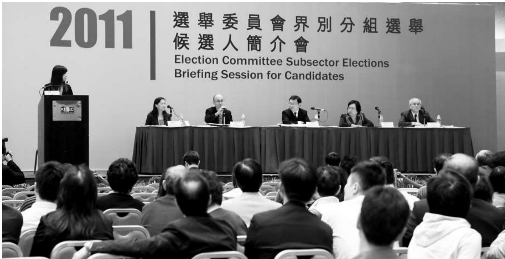
▶ 選舉管理委員會昨起為選委候選人舉行簡介會

有參選人就問到若她出席朋友婚宴，而該朋友及在場嘉賓為其選民，她所送出的禮金會否涉及賄選。廉政公署的代表解釋，若候選人未藉禮金交換選票，只是正常的社交禮儀，不會構成違法行為。不過馮驊補充時提到，若席間有人自發助其拉票，可能要計算選舉經費，呼籲候選人或需要避席。選管會今早及下午會為餘下界別作簡介。