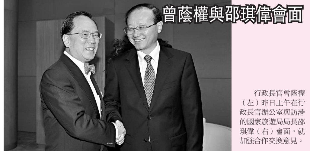
行政長官曾蔭權（左）昨日上午在行政長官辦公室與訪港的國家旅遊局局長邵琪偉（右）會面，就加強合作交換意見。