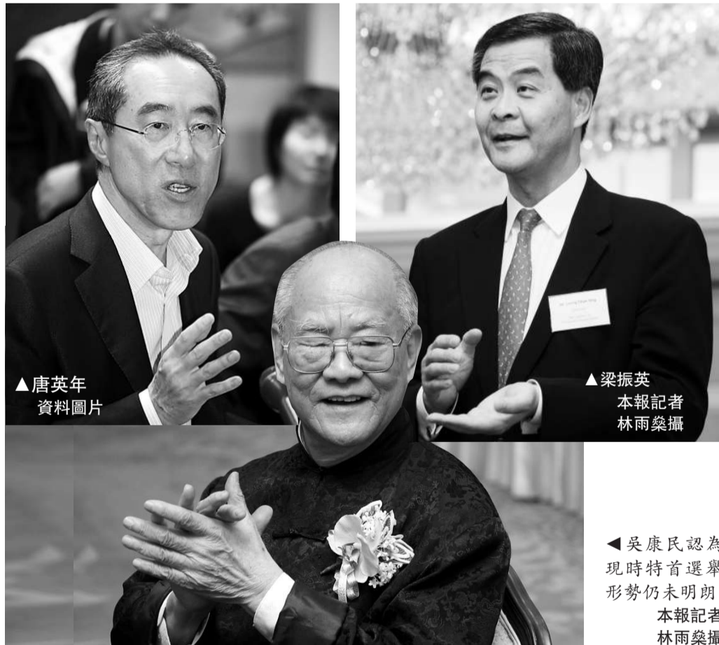
▲ 唐英年

一向支持唐英年參選特首的自由黨榮譽主席田北俊再表態支持唐英年參選。他認為，綁開對唐英年的民望有負面影響，但希望公眾能夠把私生活和治港能力分割開。田北俊說，唐英年出身商界，熟悉商業運作，並在政府工作十年，對政府的政策很熟悉。現時歐美經濟情況不好，因此現需要一位有國際視野的特首來帶領香港。經濟動力的林健鋒認為，香港需要一個有信心、有能幹、有遠景的人去領導，而唐英年前日在記者會上表示自己「I am better（我是較好的）」，就是一種自信的表現。