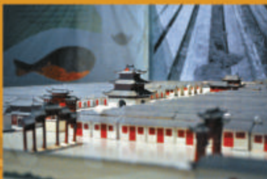
◀會試考場——北京順天貢院（模型），共設九千零四十間「格子間」