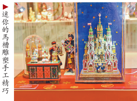
▶迷你的馬槽雕塑手工精巧

大衛在製作 Szopka 的過程，最大收穫是人與人之間的情誼：「我的學生中有對夫婦，是今次展覽作品『LOVE SZOPKA』的製作者。他們參加製作班以後，卻經常意見不合，我就從製作技巧上加以循循善誘。到了後來，有天他們聯同其他學生為我辦了一個驚喜生日派對，我們像家人一樣玩得很高興。席間，那個妻子把我拉到一旁，並跟我說了句『謝謝你，因為這個課程，我們兩夫婦之間的了解也比以前更好，現在我們更懂得愛對方了！』我感到很欣慰，這就是民間工藝的存在意義了。」