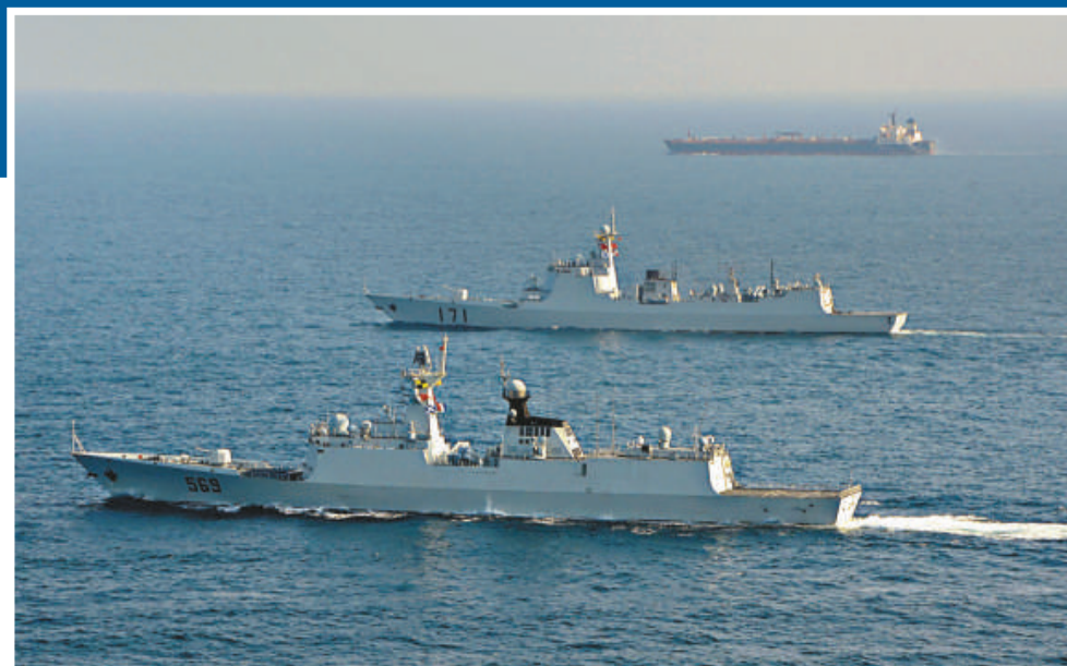
▲中國海軍第九批、第十批護航編隊完成第二次共同護航任務後航。圖為兩批護航編隊共同護衛商船到達解護點

共同社23日也對此進行了報道，並表示由於沖繩一宮古之間水道屬於公海，因此中國海軍的行動並不違反《國際法》。報道還說，由於近年來中國海軍的活動日漸活躍，有觀點認為，此次活動目的是為在太平洋海域實施燃料補給訓練的同時，對日本自衛隊為加強「西南海域」防禦而實施的「警戒監視」進行確認。