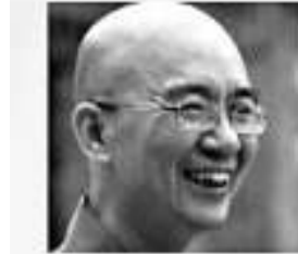
▲學誠法師用禪心「織圍脖」，他的粉絲已多達8.4萬人