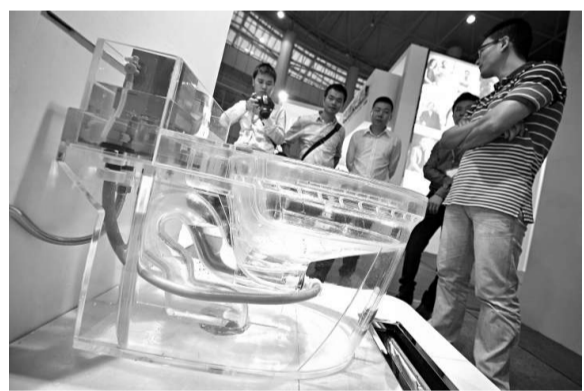
▲觀眾在參觀一個透視馬桶的內部構造和運作原理