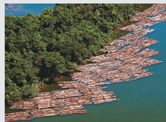
▲巴西亞馬遜河流域亂砍濫伐情形嚴重 資料圖片