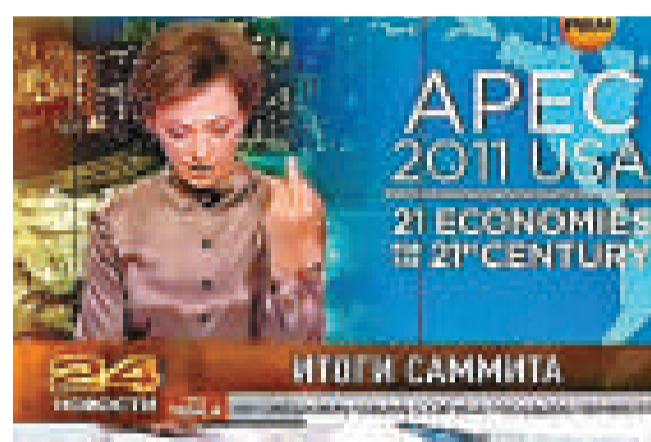
俄羅斯馬諾娃在直播時豎起中指 奧巴馬 互聯網

歐洲反導系統是美國總統奧巴馬上台後力推的國安政策，也是美俄發生激烈爭吵的一大焦點問題。特別是今年9月以來，美國反導部署明顯提速，先後說服羅馬尼亞、波蘭部署地基標準-3型攔截導彈，土耳其部署尖端雷達，西班牙部署4艘美軍裝備「宙斯盾」反導系統的驅逐艦。俄羅斯已經表示，這種系統將擾亂俄羅斯的導彈核威懾力量，並破壞在歐洲的戰略武器平衡。