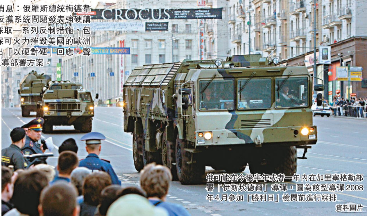
俄可能在今後半年或者一年內在加里寧格勒部署「伊斯坎德爾」導彈，圖為該型導彈2008年4月參加「勝利日」檢閱前進行隊排 資料圖片

梅德韋傑夫警告說，假如美國一意孤行，在歐洲部署導彈防禦系統，俄羅斯會退出俄美核裁軍條約。他