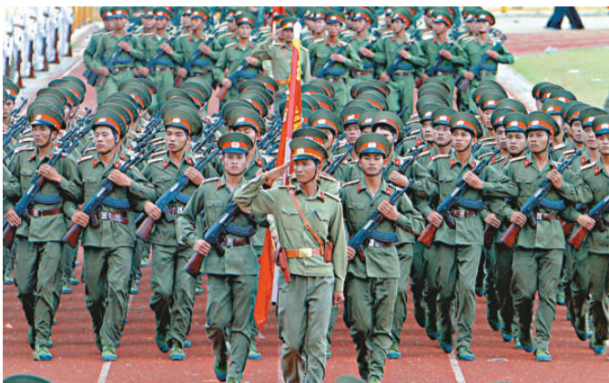
▲越軍士兵在奠邊府進行檢閱

【本報訊】據中通社河內24日消息：據俄羅斯世界武器貿易分析中心網站報導，越南政府已決定將2012年度的國防預算大幅度提高至22.7億美元，較今年增長約35%，將佔到越國家預算支出總額的8%。