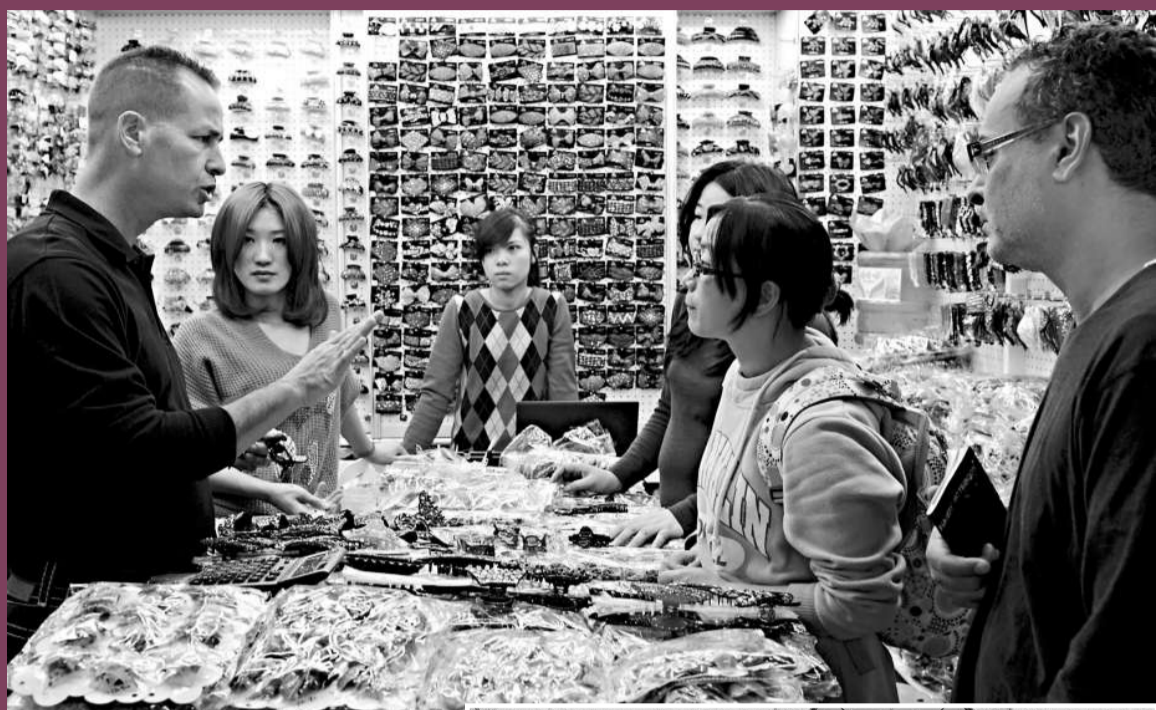
▲專家認為，決策部門將「適時適度、預調微調」重心放在支持中小企業發展上，搞活實體經濟，對中國經濟的持續增長十分重要。圖為外國客商在義烏國際商貿城採購飾品

財政部、國家稅務總局10月31日發布修改後的《中華人民共和國增值稅暫行條例實施細則》和《中華人民共和國營業稅暫行條例實施細則》，上調增值稅和營業稅起徵點的幅度。修訂後的細則從11月1日起施行。