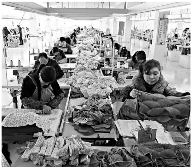
▲工人在安徽阜陽穎泉區阜陽工業園區一家服飾公司內加工服裝