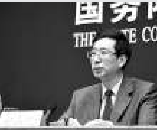
▲現年58歲的胡占凡畢業於北京廣播學院，「科班出身」，曾長期在新聞一線工作。

與胡占凡一樣，焦利也是記者出身，曾任遼寧日報社社長。2001年任遼寧省委常委、宣傳部長，大力推進改革，遼寧出版傳媒股份公司成為中國第一家把編輯業務和經營業務一同打包上市的傳媒企業。2008年焦利調任中宣部副部長，次年5月接替趙化勇出任中央電視台台長。後者曾因央視新址大火受到行政降級處分。