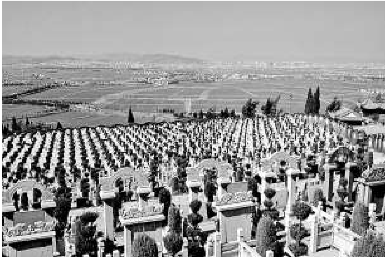
▲近年來，殯葬價格「水漲船高」，動輒1平方米數萬元的墓穴和不斷攀升的殯葬用品價格，「死不起」的殯葬暴利已成為威脅社會穩定的一大結核。

據殯儀館的統計，每年在深圳市人民醫院、市二人民醫院和北大醫院三家醫院離世的人數，佔每年至市死亡人數的六成左右。其中，2007年至2009年，市二醫院和北大醫院太平間的遺體，有超三分之一超時存放，其中亦有港籍人員在深圳亡故無人認領的情況。一旦這項「基本服務政府買單計劃」，面對範圍亦將