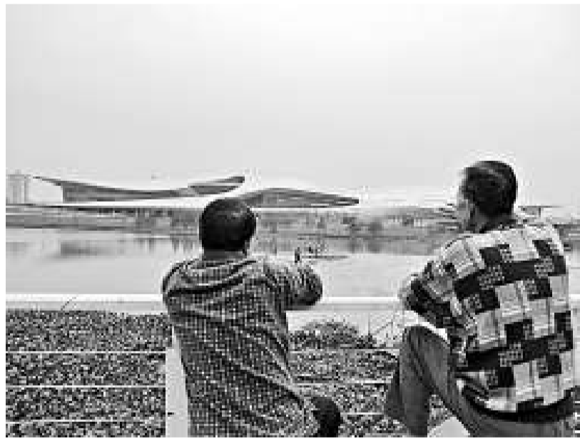
▲附近居民對亞運城體育館「可望不可及」。

據介紹，即使不開放，場館內高檔設備的維護和日常管養的成本也很高，每月產生的水電等費用就高達11萬元。