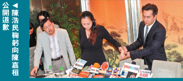
陳浩民鞠躬向陳嘉桓公開道歉