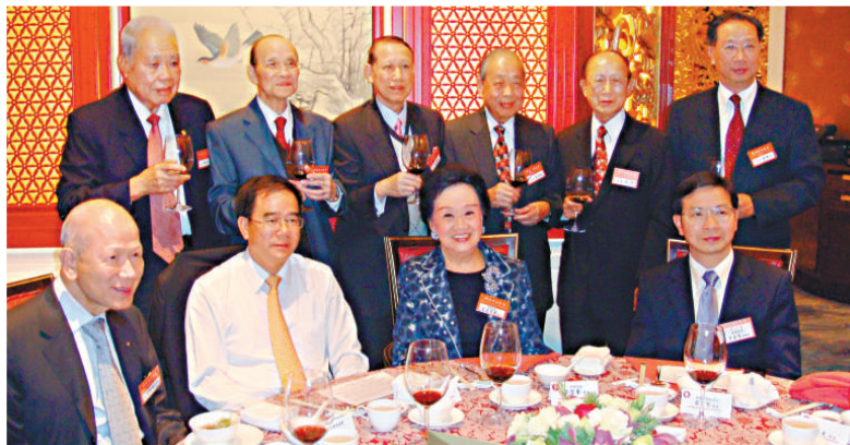
▼經聯會首長出席晚宴，場面熱鬧