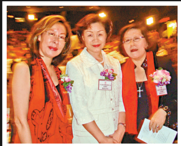
▲中聯辦協調部副部長廖勵（中）