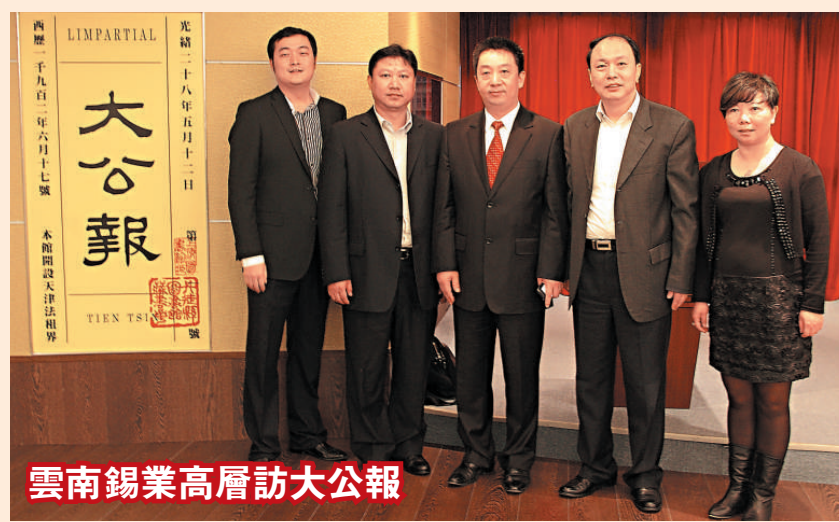
雲南錫業高層訪大公報

中芭團員演出了清麗脫俗的雙人舞及翩翩群舞，融貫了東方與西方芭蕾舞藝術，以及古典與現代的芭蕾舞激情，配以唯美悠揚的樂曲、幻變多姿的舞台效果，相互輝映，為觀眾帶來了美與浪漫的藝術享受，令人目不暇給，中芭團員的出色表現深受觀眾好評並報以熱烈掌聲。