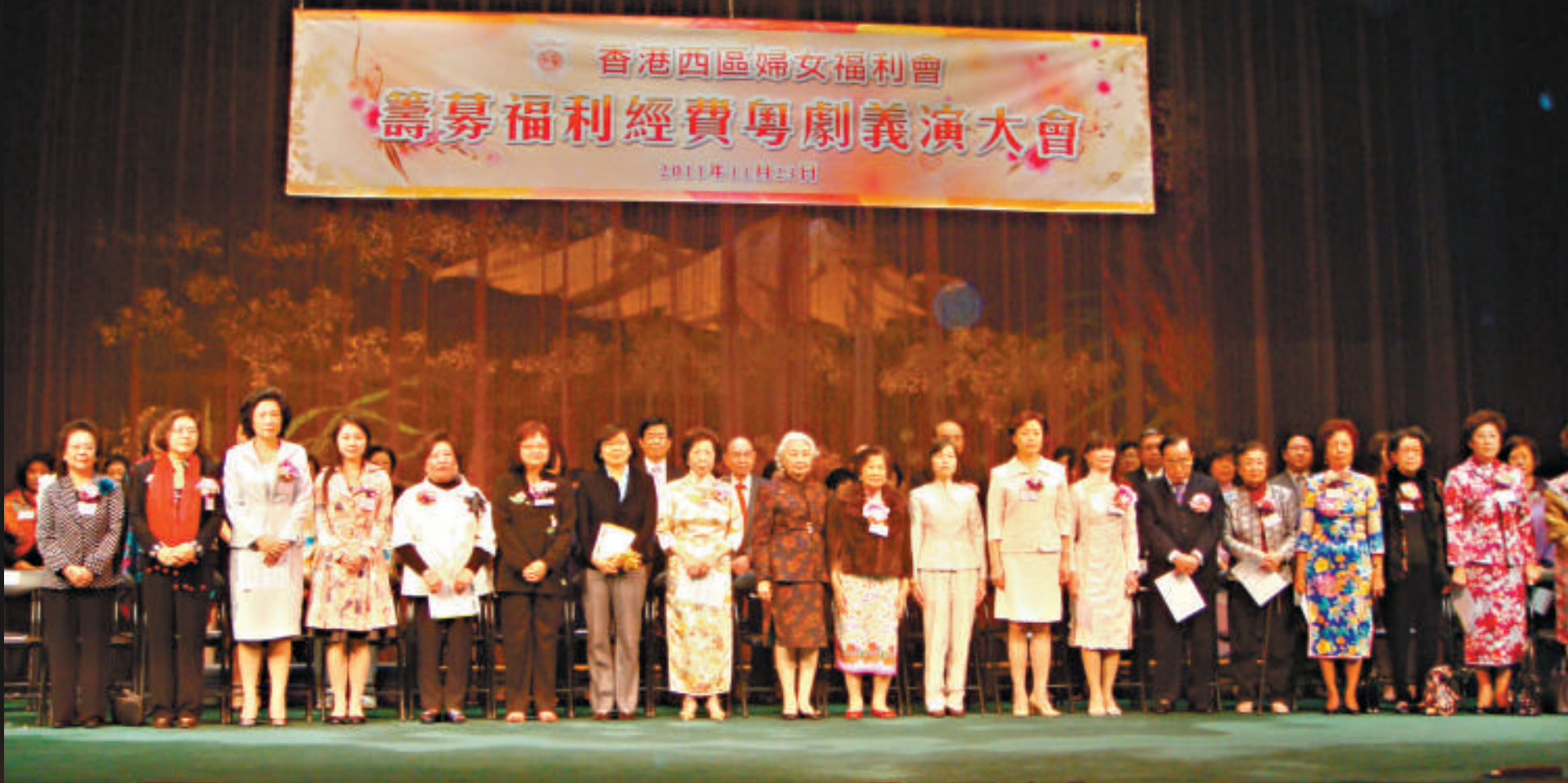
▲香港西區婦女福利會日前舉行粵劇義演籌款非常成功

香港西區婦女福利會籌募福利經費粵劇義演大會，前晚在新光戲院舉行。全國人大常委會香港特別行政區基本法委員會副主任梁愛詩、民政事務局副局長許曉暉、社會福利署副署長麥周淑霞、中聯辦協調部副部長廖勵等應邀出席主禮。