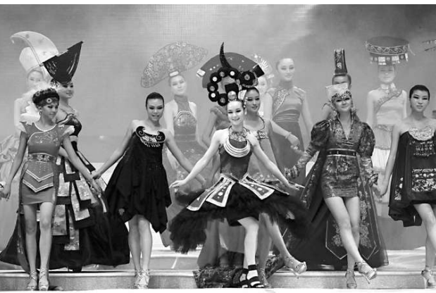
首屆少數民族模特大賽在貴陽進行總決賽。參賽的25位來自雲南、貴州、四川、新疆、湖北、山西等地的少數民族佳麗平均年齡為21歲，平均身高174厘米，全部擁有大專以上學歷。

總之，經區選這一役，孰好孰壞，孰優孰劣，市民看得更清楚，而人民力量與社民連不顧反省悔悟，仍將堅持暴力抗爭，等待着他們的只能是更大的失敗！