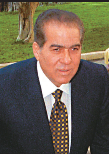
▲卡邁勒·詹祖里。

日到中國訪問。訪問期間，他曾表示，埃及應該學習中國經濟改革發展的經驗。詹祖里本人曾表示，他非常喜歡中國文化。2007年，在世界華僑華人社團聯合總會舉辦中外文化交流活動期間，詹祖里在接受中國著名藝術家贈予的繪畫作品時說，「我十分熱愛中國文化，我會把你們贈給我的這幅中國著名藝術家的繪畫藝術品，作為埃中兩國友誼的見證好好珍藏。」