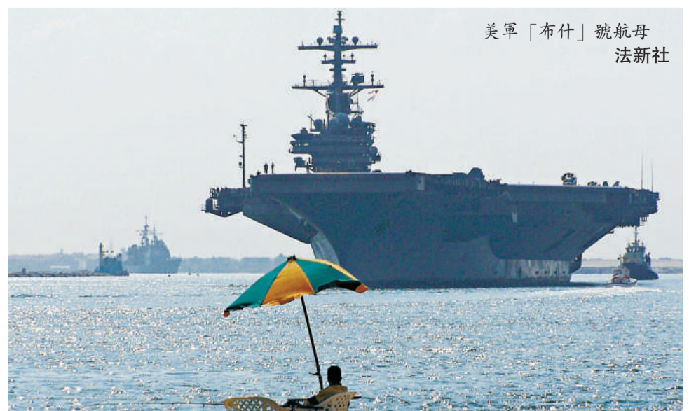
▲美軍「布什」號航母。

他說，中方高度關注當前敘利亞局勢，希望阿盟與敘利亞從維護敘人民根本利益和中東和平穩定的大局出發，為結束敘危機加強溝通和協調，妥善解決有關問題。 俄羅斯外交部則發表聲明，表明反對制裁和施壓。俄外交部發言人周五稱，現階段所要的不是決議案、制裁或壓力，而是敘利亞內部之間的對話。