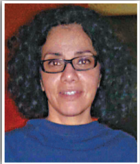
▲美國專欄作家艾塔哈維。

拉比在一起，在解放廣場通往內政部大樓的路上拍攝，突然被一大群14、15歲的少年包圍。她和阿格拉比被強行拖往解放廣場，兩人被分開。有大群人圍毆她，更有人出手撕她的衣服。她當時很擔心自己是否會被強姦。 辛茲說：「有些人想要幫我掙脫但最後沒有成功。我被凌辱長達45分鐘，之後被救了出來。我覺得我快要死了。」和她一起的攝影師也遭到圍毆。 辛茲是被一群埃及民眾救出並送到她入住的賓館，之後在法國大使館的保護下查看了醫生。 無國界記者組織強烈譴責埃及及現時的採訪環境，發表聲明說：「埃及現在的騷亂以及所致的嚴重踐踏人權的行為，和1、2月份革命早期那段最黑暗的日子一樣，一樣令人震驚並感到害怕。」 聲明表示，鑒於埃及局勢動盪，發生多宗女記者被侵犯的事件，建議傳媒機構暫停派遣女性進入埃及採訪。