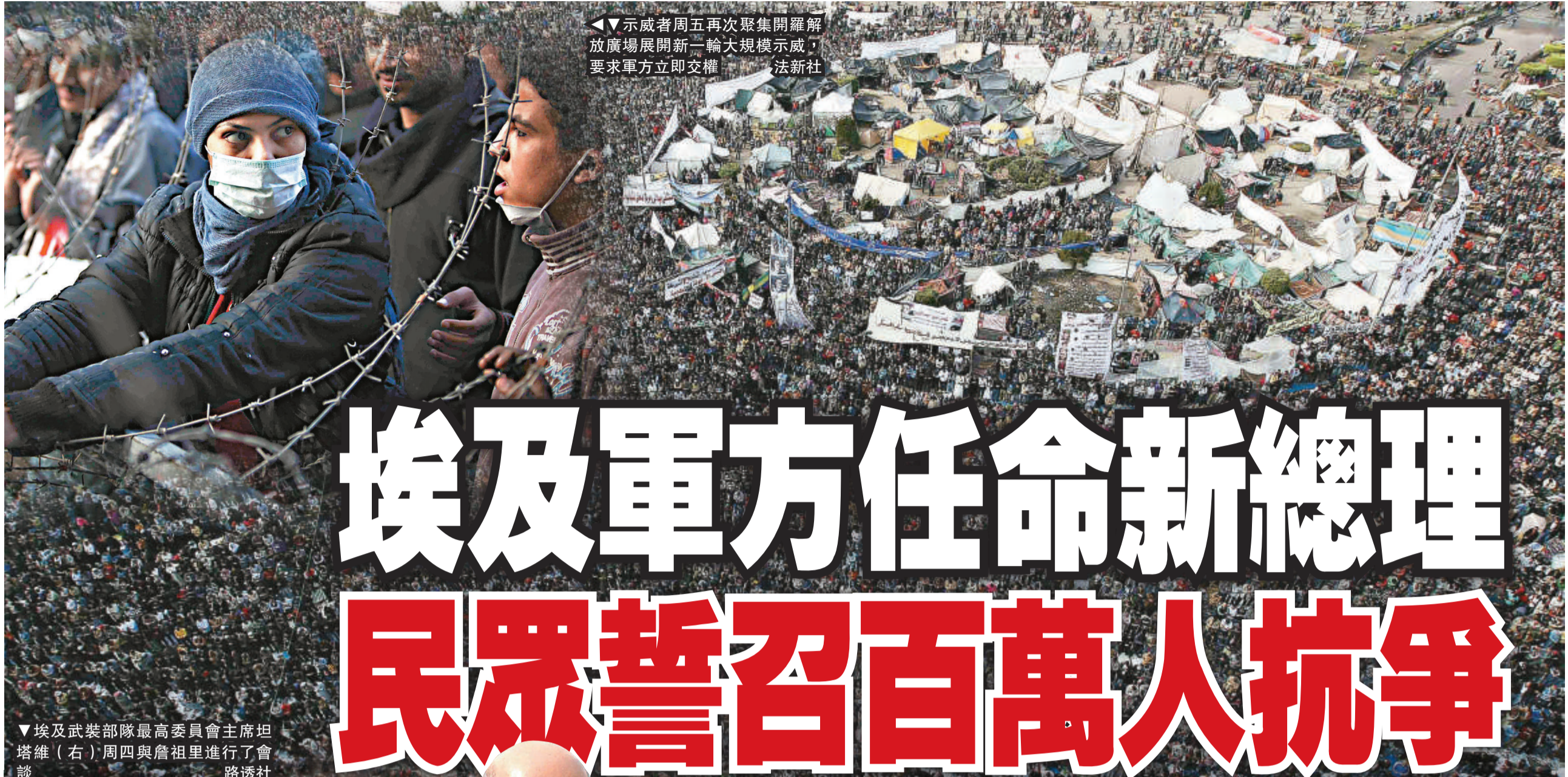
◀▼示威者周五再次聚集開羅解放廣場展開新一輪大規模示威，要求軍方立即交權。