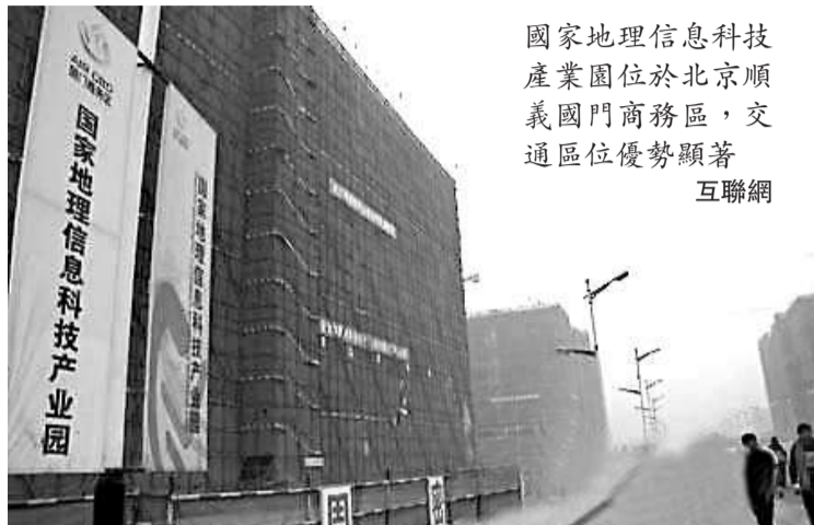
國家地理信息科技產業園位於北京順義國門商務區，交通区位优势顯著 互聯網

據了解，國家地理信息科技產業園投入使用後，園區將吸引100家以上國內外地理空間信息企業，年產值達千億元；形成以地理信息及其相關產業為主體，以金融服務等第三產業為支撐的國家級地理信息產業平台；建設一個具有全國輻射力和國際影響力、產業鏈相對完