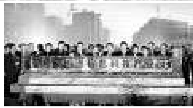
▲中國首個國家級地理信息科技產業園首批22家企業入園

地理信息產業正在成為中國現代服務業中迅速崛起的新的經濟增長點，近年來年均增速超過25%，2011年產值有望達到1500億元。今日中國首個國家級地理信息科技產業園迎來首批22家企業入園，矢言打造世界地理信息產業「硅谷」。