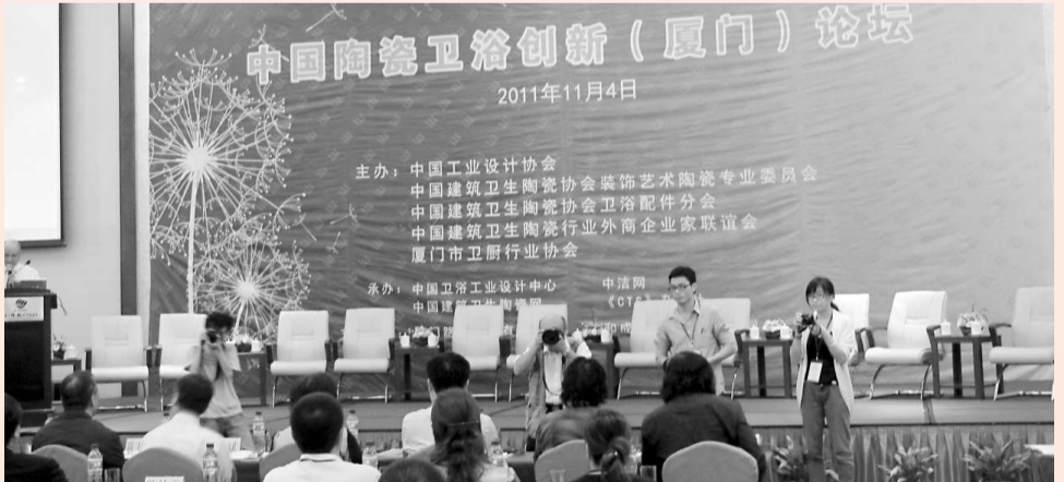
▲2011年中國陶瓷衛浴創新論壇圍繞「中國創新與品牌建設」主題，展開對話

件等領域相關聯產品。 展會以進出口貿易為導向，加盟採購訂貨相結合，旨在推動我國廚衛市場與產業的互動發展，為廣大廚衛生產企業搭建一個同行間交流及展示的平台。 本屆展會期間還同時舉行2011年中國建陶協會衛浴分會及淋浴房分會年會、中國陶瓷衛浴創新論壇等相關活動。（李珊）