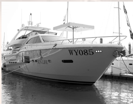
▲飛馳遊艇攜包括ALTURA840在內的8艘名艇參展，成為本屆遊艇帆船展最受矚目的參展商之一

11月5日，全球最大的豪華遊艇製造商——意大利法拉帝集團在廈門舉辦「領航、尊享、馳騁」主題活動，為其法拉帝遊艇40周年紀念版產品ALTURA840（全長25.76米）舉行中國首航禮。這是迄今落戶福建的最大進口豪華遊艇，也是法拉帝售往亞洲的首艘ALTURA840。