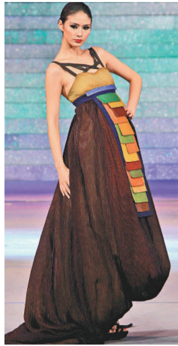
▲模特兒在舞台上展示參賽設計師的作品