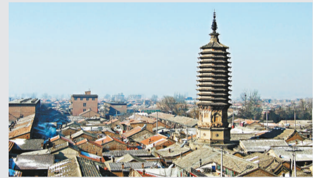
▲河北蔚縣南安寺塔塔高28米，為一座八角十三級實心密檐磚塔 網上圖片

河北省文物專家表示，被盜文物數量之多，珍貴程度和歷史研究價值實為罕見。追繳的金器、銀器、青銅器、木器、瓷器等109件文物中，重檐金塔、仰蓮座重檐銀塔、蓮座彩繪木塔、鑲金木塔、彩繪木雕四大天王像等文物工藝精湛，是國內難得一見的文物珍品，對研究遼代社會的政治經濟文化具有極其重要價值。