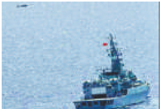
▲中國海軍艦艇編隊太平洋訓練，圖左上角可見海軍無人機協同活動

作為中國最北的沿海省份，遼寧省地處東北亞地區中心位置，面向太平洋，是中國萬里海疆的最北端，與朝鮮隔江相望，南鄰黃海、渤海。大陸海岸線全長約2200公里，島嶼岸線長約650公里，海域面積約15.02萬平方公里，近海分布大小島嶼506個，島嶼面積約187平方公里。