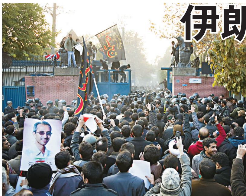
▲伊朗學生29日在德黑蘭衝擊英國大使館 ▶英國大使館的國旗被伊朗學生焚燒

【本報訊】據法新社29日德黑蘭消息：一群伊朗示威者29日闖入了英國駐德黑蘭大使館，在警察趕到之前奪走了大使館的英國國旗並洗劫了辦公室、遺放火燒車。英國政府對這一事件表示十分「憤怒」，稱「絕不接受這一做法並做出強烈譴責」。