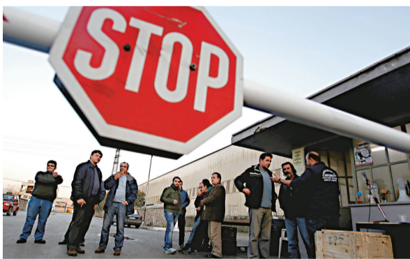
▲希臘鋼鐵公司的工人反對削減工資舉行的罷工28日進入第29天，圖為位於雅典的該公司

【本報訊】據美聯社二十九日消息：歐元區17國財長周二在歐盟總部布魯塞爾舉行會晤，商討措施挽救歐元，並避免歐洲、美國、亞洲和世界其他的經濟體捲入這場由債務引發的金融海嘯之中。