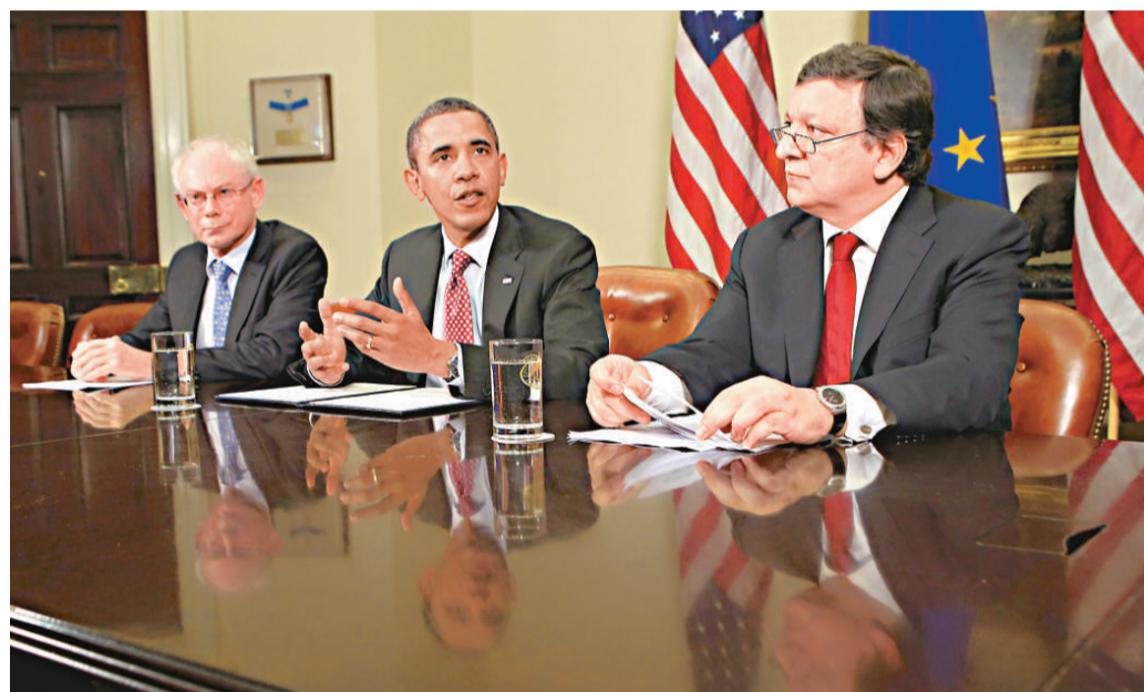
▲美國總統奧巴馬在白宮與歐洲委員會主席范龍佩（左）和歐盟委員會主席巴羅佐（右）

至於美國如何向歐洲提供幫助，美國駐歐盟大使威廉·肯納德說，奧巴馬在會談中明確告訴歐盟領導人，在歐元區應對債務危機過程中，美國將根據應對2008