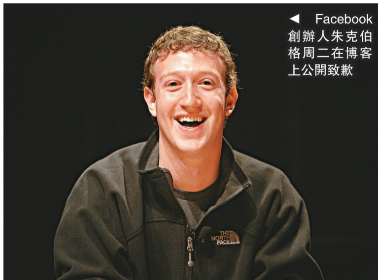
Facebook 創辦人朱克伯格周二在博客上公開致歉