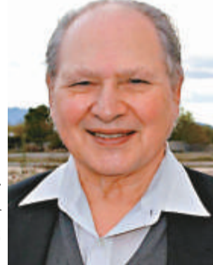
▶鮮為人知的「第三合夥人」朗納德·韋恩

那家小公司就是後來全球最大科技公司蘋果，而韋恩似乎從未對他出售手中股份感到難受，可見他確實是一位很看得開的人。