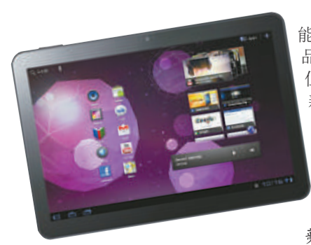
▲三星平板電腦被指侵犯了蘋果iPad的知識產權

Galaxy 10.1 Tab被認為是最能夠與蘋果平板iPad一較高下的產品。三星得知判決後表示歡迎，但不代表該產品能立即在澳洲重新發售，因為蘋果可在當地時間周五（12月4日）下午4時前，向最高法院提出延長禁售要求。