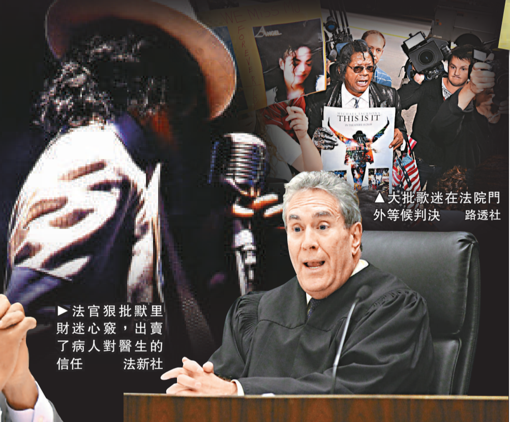
▶法官狠批默里財迷心竅，出賣了病人對醫生的信任