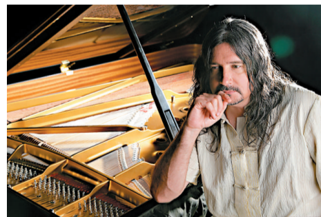
▲馬修·連恩將在深圳舉行音樂會

【本報訊】記者王一梅深圳報道:被稱為國際環保音樂家的馬修·連恩,通過自己的音樂在全世界範圍呼籲大家愛護自然,珍愛生命。十二月三日(周六)晚八點,深圳音樂廳將舉行一場馬修·連恩深圳音樂會。屆時,馬修將為觀眾呈獻《狼》、《布列瑟農》、《匯流》等環保音樂以及富有台灣風味的《台灣客翻天》等作品。