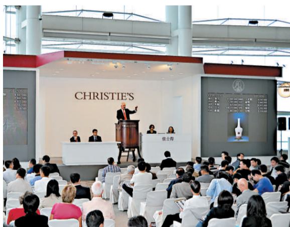
▲香港佳士得「重要中國瓷器及工藝精品」拍賣現場