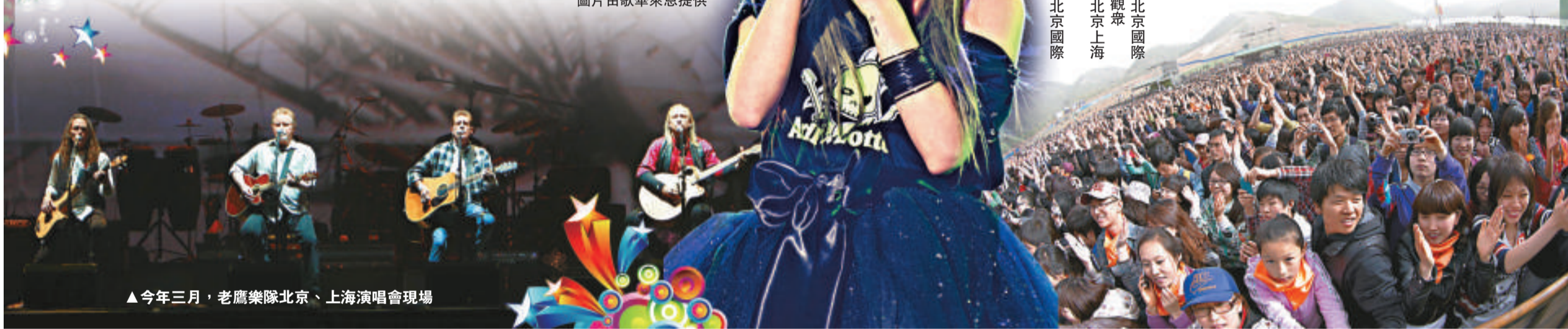
▲今年三月,老鷹樂隊北京、上海演唱會現場