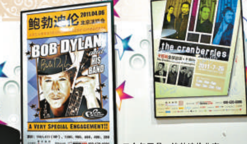
▼今年四月,鮑勃迪倫北京、上海演唱會現場