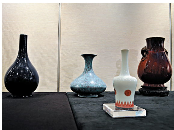
▲康熙青花釉裡紅團花齒紋絞鈴尊(右二)以低於估價的一千一百八十六萬元拍出

【本報訊】記者李夢報道:香港佳士得昨日舉行「重要中國瓷器及工藝精品」日間拍賣。四百二十六項拍品成交二百四十項,總成交額約四億五千六百萬元,遠低於先前六億元總估價。重要拍品拍賣成績平平,全場估價最高(二千八百萬至三千五百萬元)的青花纏枝蓮紋如意耳扁壺最終流拍。