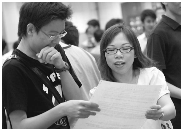
▲家長要了解子女強弱項，更要和他們一起搜集資料、作他們的最強後盾，協助謀出路

曾聽過學生抱怨父母只關心學業，探問他們學校學習時亦只理成績：「佢哋認為其他活動只是調劑，可以放低，讀書先緊要。」其實新學制鼓勵同學參與不同的學習經歷，亦有參與和工作有關的經驗，將記錄在學生學習檔案