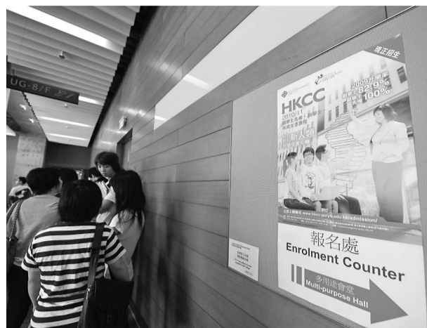
▲香港多間大學也設有副學位課程，為學生提供不同升學出路；圖為理大副學位於去年高考放榜後招生