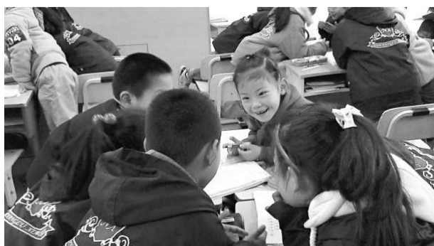
▲當焦點在小組討論時，同學要圍着坐、臉對臉交流

其實，座位編排只是一個外在的形式，最重要是配合教學的實際需要。典型的傳統教學是老師講、學生聽，因此「排排坐」的設計就是讓每個學生都專心看着老師和黑板，而不是跟旁邊的同學談話，其形式和實際需要配合得天衣無縫。類似的座位編排還有音樂會、佈道會，全體參加者都恆常地朝向一個固定的焦點。