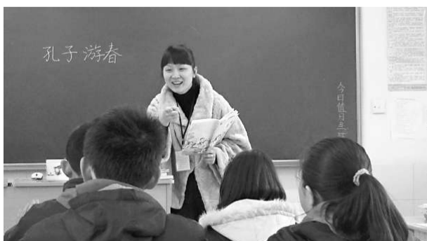
▲任何時間都要求學生正面面向課堂活動焦點；圖為南京小班中文課，焦點在老師

無論大班小班，座位都須要配合教學需要而安排、按需要作適當調整。像上述的常識課，如果是大班，座位編排的轉換是有一定難度的。小班的好處是它空間更寬裕，轉變更靈活，老師管理更容易（如果班裡充滿活力旺盛的搗蛋鬼，又作別論）。有些老師的安排很簡單快捷，基本上維持「排排坐」的局面，需要分組便請同學們略作轉移