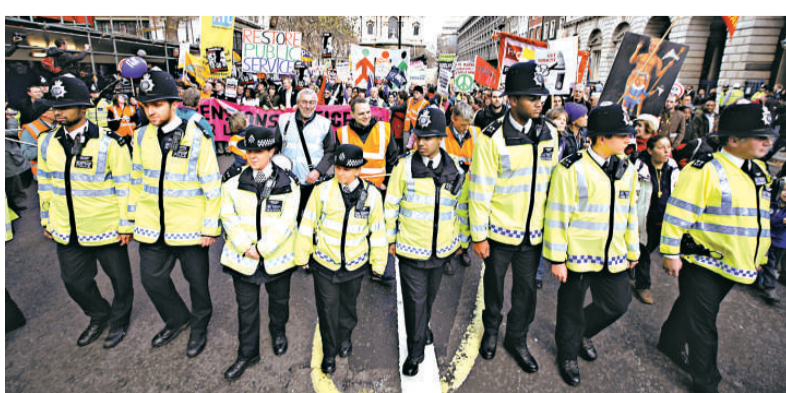
▶英國倫敦，警方30日在罷工人群前警戒

就連一直同情公務員待遇的《獨立報》也說，罷工者們選了一個「糟糕的時間」，但同時強調罷工是他們應有的權力。