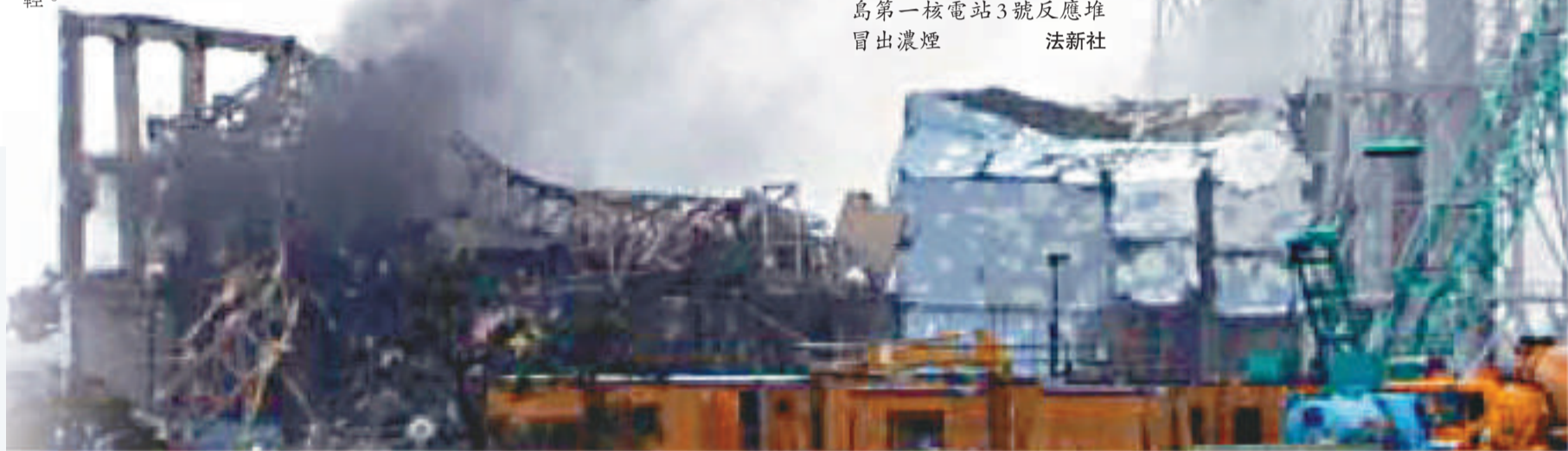
今年三月地震後，日本福島第一核電站3號反應堆冒出濃煙

東電30日表示，2號和3號反應堆的核燃料也有六成左右熔毀後掉入壓力容器，對容器混凝土壁的侵蝕最深分別達到12厘米和20厘米，但受破壞程度，比一號機組輕。