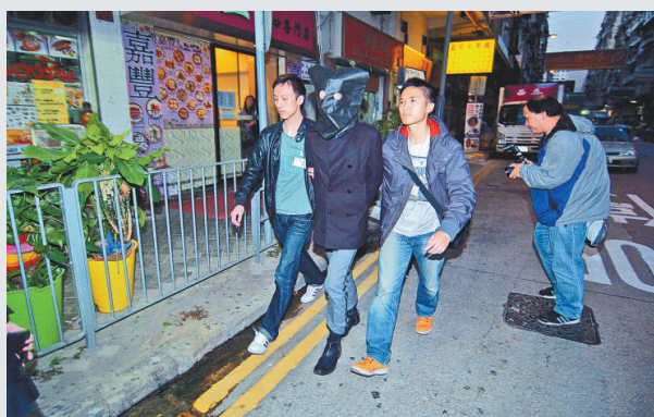
▲懷疑透過社交網站約異性見面時竊取iPhone的男子落網

昨日中午十二時許，一輛的士沿油麻地加士居道左轉入伊利沙伯醫院時，路面突然下陷，的士尾胎陷墮坑洞，司機察覺及時加速向前駛，離開下陷路段後，發現路面有一個約兩米乘兩米的大洞，深約七米，洞底有少量水漬，幸司機沒受傷忙通知保安員報警。警員接報到場調查，不排除地底水管出現滲漏，沙石被沖走，路面頓失承托力導致意外，通知路政署到場處理，並將通往伊利沙伯醫院正門通道封閉，救護車及其他車輛須改用衛理道。