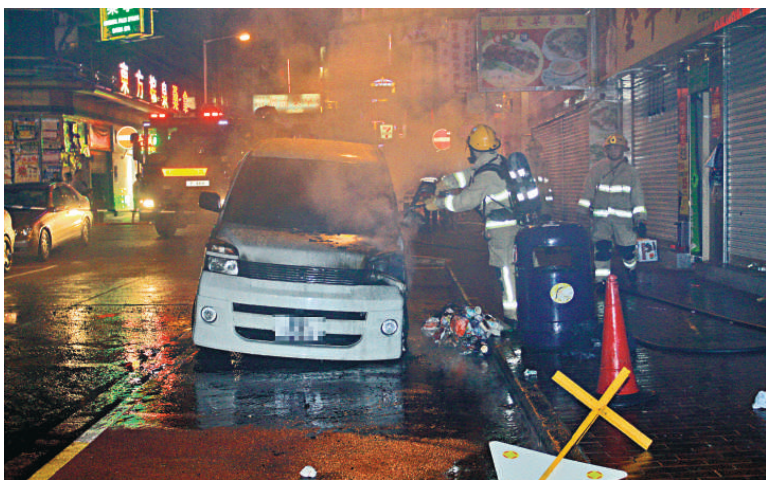
▲七人車車頭起火冒出大量濃煙，驚動附近居民

起火的為一部七人私家車，剛落地一個月，事發時停泊於路邊一個小巴站頭，當時男司機將車泊在路邊後離開，約半小時後，七人車的車頭突然冒煙起火。 事發於昨晨五時許，一輛停泊在白加士街一一三至一三五號路旁的白色七人私家車，突然冒煙起火焚燒，冒出大量濃煙，直湧上附近大廈，一名姓鄧女途人見狀，立即致電報警，消防員接報到場開喉展開撲救，約十分鐘後將火撲熄，火警期間，現場附近大廈居民恐防翻版「花園街大火」而受火警波及，十多名住客逃出屋外落樓或登上天台逃避煙火，直至火警撲熄後他