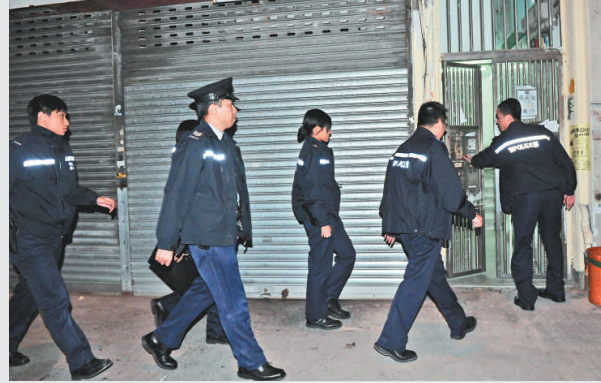
▲醉漢誤報自己「殺妻」，令警方大為緊張，派多人上門調查，後證實是虛驚一場

們始返回寓所，火警中無人受傷，着火私家車車頭及前半部車廂被焚毀，消防員經調查後相信因機件過熱引致，火警並無可疑，司機事後返回現場協助向警方提供資料。