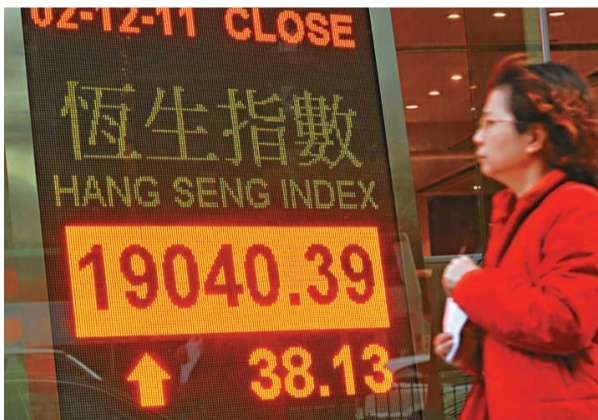
▲港股昨日承接外圍股市利好氣氛，恒指先跌後反彈，最多升 149 點，收市時升幅縮窄至 38 點

（00047）斥資 34.7 億元收購吉野家及連鎖甜品店「冰雪皇后」在內地的經營權，股價應聲爆升 59%，收報 0.7 元，是昨日升幅最大股份。