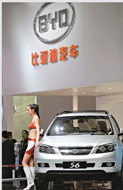
▲比亞迪宣布，取得深圳市市場監督管理局換發的《企業法人營業執照》

變更後，公司的經營範圍為離子電池以及其他電池、充電器、電子產品、儀器儀表、柔性線路板、五金製品、液晶顯示器、手機零配件、模具、塑料製品及其相關附件的生產、銷售；貨物及技術進出口；道路普通貨運；3D 眼鏡、GPS 導航產品的研發、生產及銷售。