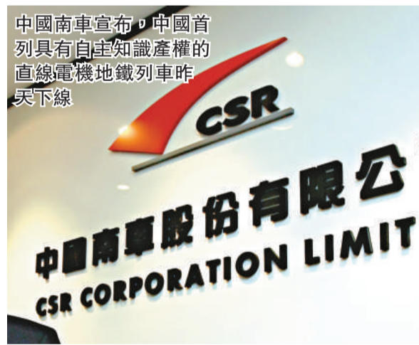
中國南車宣布，中國首列具有自主知識產權的直線電機地鐵列車昨天下線

27.8 億元合同具體包括，南車青島四方機車車輛股份與相關鐵路局簽訂的總價值 20.7 億元的動車組檢修合同、青島四方龐巴迪鐵路運輸設備與鐵道部相關鐵路局簽訂的總價值 3.6 億元的動車組檢修合同、南車南京浦鎮車輛和南車四方車輛及南車成都機車車輛與相關鐵路局簽訂的總價值為 3.5 億元的客車修理合同。