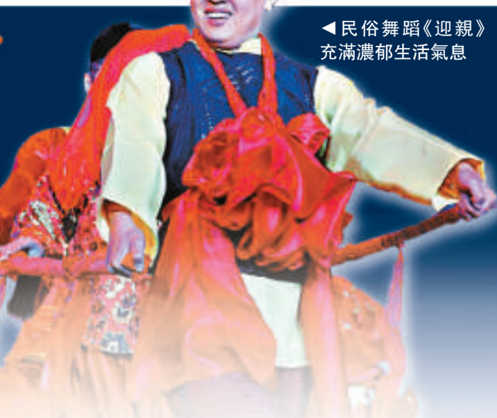
◀民俗舞蹈《迎親》充滿濃郁生活氣息

氛熱烈，民俗舞蹈《迎親》，帶著濃郁的生活氣息熱烈登場；宮廷裡發生着荒唐古怪的笑話典故，觀眾彷彿被帶到了昔日的王朝時代，波瀾跌宕、氣勢磅礴的大河南岸，沃野千里、廣袤無垠的綠色中原。