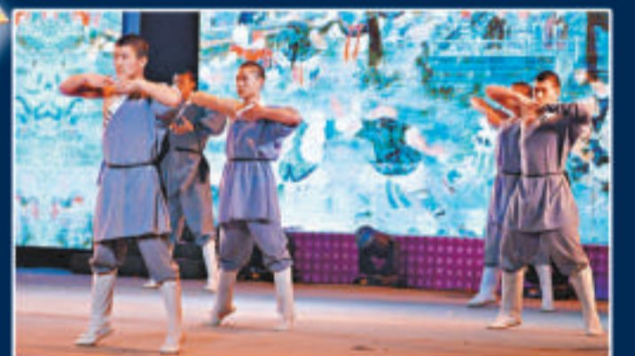
▲少林武僧英武逼人