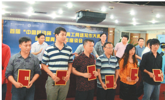
◀獲獎青工在台上合照 本報攝