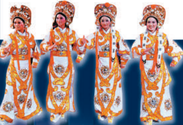
▶歡快的節奏結束整場演藝秀