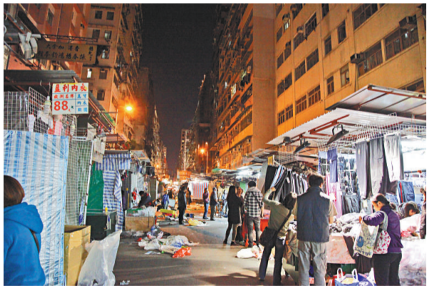
▲部分排檔檔主昨獲准返回檔口清理存貨和點算損失