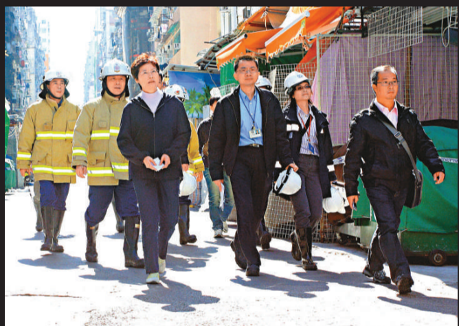
▲林鄭月娥昨天到花園街四級火現場巡視