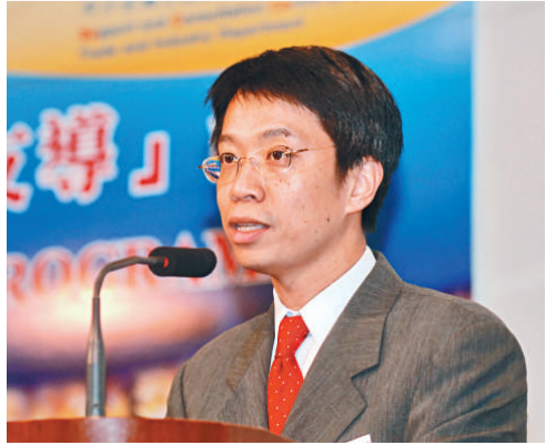
▲梁卓文表示，食環署考慮引入排檔扣分及取消牌照機制

而食物及衛生局局長周一嶽出席公開活動時表示，單靠排檔檔主自律守法並不容易，食環署亦需要嚴厲執法，至於相關的扣分制或吊銷牌照機制，則需要再作討論。他強調所有檔主都是基層市民，希望檔主在不影響居民的情況下維持生計，如有措施能減低火警風險，就不需要取消排檔，他重申各項改善方案要平衡檔主生計及附近居民安全。