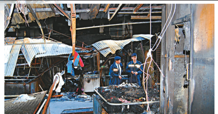
▲警方昨天繼續在四級火現場調查

【本報訊】警方至今仍未確定釀成旺角花園街四級火慘劇起因，西九龍總區刑事總部警司盧國基表示，由於搜證需時，目前暫將案件列作「四級火有可疑案件」處理，不排除涉及刑事成分，而警方現階段並無發懸紅緝兇，亦無鎖定南亞裔可疑人。至於早前閉路電視拍下的人士，其中一名八十二歲老婦已向警方提供資料，他呼籲被閉路電視拍下的另一位人士，及其他目擊者，以及拍下有關該火警短片的市民，盡快聯絡警方。 慘劇造成九死三十四傷，不同消息不脛而走，包括奪命火兇徒是兩名南亞裔男子，警方懸紅一百萬元緝兇等。盧國基警司昨日否認傳聞，指由於火災涉及範圍大，傷亡嚴重，調查人員包括警方、政府化驗所、屋宇署、機電工程署等部門，須較長時間蒐證，並要從多角度研究此案，因而目前未有定案，無鎖定任何人士，仍將案件列作「四級火有可疑案件」處理。假若證實涉及刑事成分，警方會考慮懸紅緝兇，暫時未能確定何時解封現場。 早前被花園街閉路電視拍下影像的兩名市民，其中一人是一名八十二歲老婦，警方已跟她取得聯絡，錄取口供，盧國基呼籲另一人士盡快聯絡警方。他指出，於案發日凌晨四時四十五分，相信有很多人途經火警附近街道，希望他們能聯絡警方，協助提供資料。盧又說，數日以來有多名熱心市民向警方提供，事發時所拍下的火場情況短片，數目約有五至六段，但由於角度問題，只拍到火場情況，未能拍攝到可疑人士，他呼籲其他拍到有關短片的市民，能盡快聯絡警方，好讓警方整合不同角度的災場情況和資料盡快破案。