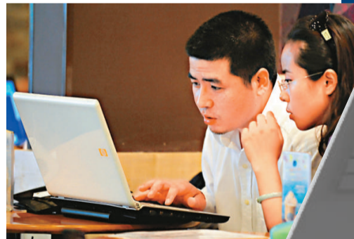
▲全國政務微博「粉絲」不斷增加 資料圖片

中國軟件評測中心是直屬於工業和信息化部的一類科研事業單位，從2002年起率領組織中國政府網站績效評估及結果發布，迄今為止已舉辦十屆。