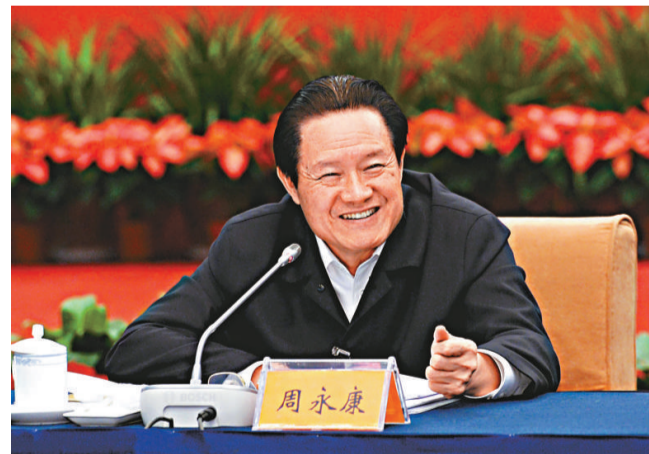
▲周永康2日出席全國加強和創新社會管理工作座談會並講話

周永康指出，加強和創新社會管理，是一項複雜的系統工程，不能就管理抓管理，必須統籌規劃設計。要統籌經濟發展、民生改善、社會穩定，針對老百姓最關心、最直接、最現實的利益問題，針對影響社會和諧穩定最突出的問題，對加強和創新社會管理進行系統研究、整體規劃。要注重觀念的轉變、要素的集成、資源的整合、方法的改進，破解各種體制性障礙