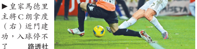
▲皇家馬德里主將C朗拿度(右)近門建功，入球停不了。