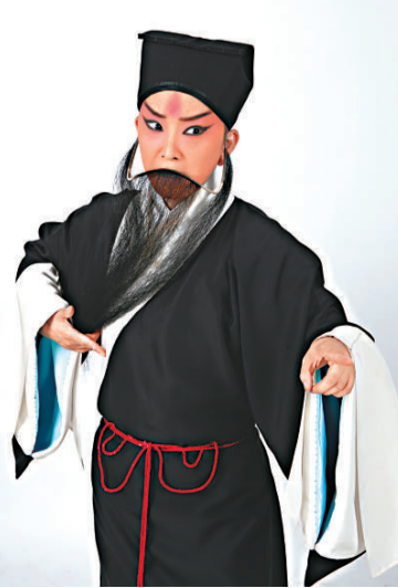
▲王珮瑜在《瓊林宴》中扮演范仲高