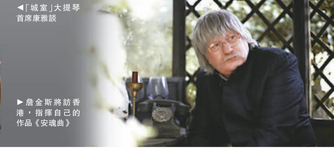
▶詹金斯將訪香港,指揮自己的作品《安魂曲》