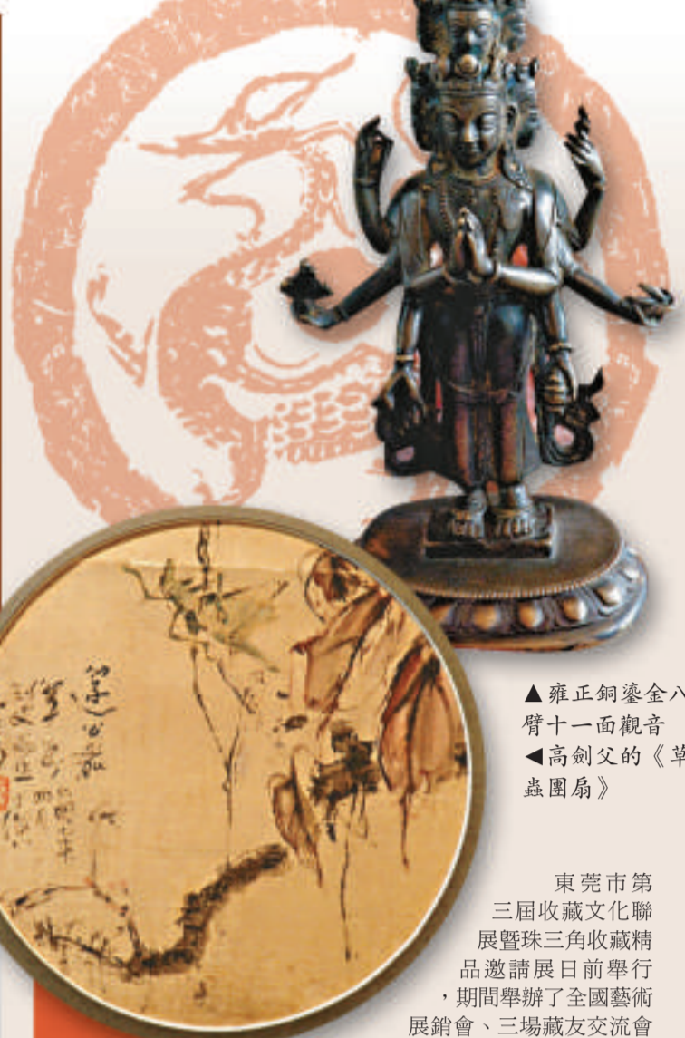
▲雍正銅鑲金八臂十一面觀音 ▲高劍父的《草蟲團扇》