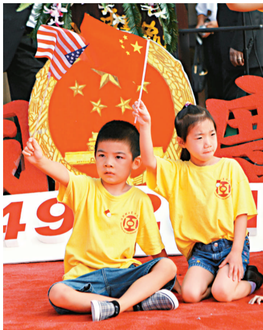
▲真正的愛國者不受地域限制，圖為美國休斯敦的華僑慶祝中華人民共和國建國62周年活動

道理很簡單：愛國也要分開感情及理性兩個部分。這等於愛一個人，必須感性及理性並重。你對所愛的人沒有充分的認識，怎麼知道如何照顧他／她？如何為他／她設想？一味遷就，只是溺愛，不是真愛。愛國亦如是：盲