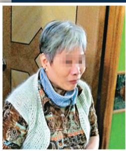
▲曹婆婆表示，不記得何時被登記做選民