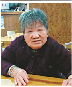
▲對於被登記做選民，陳婆婆顯得毫無頭緒