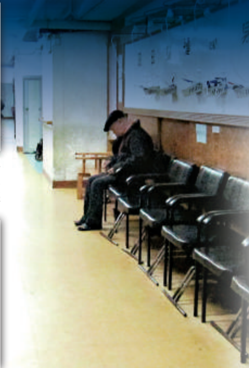
▲老人院被懷疑利用作大量「種票」