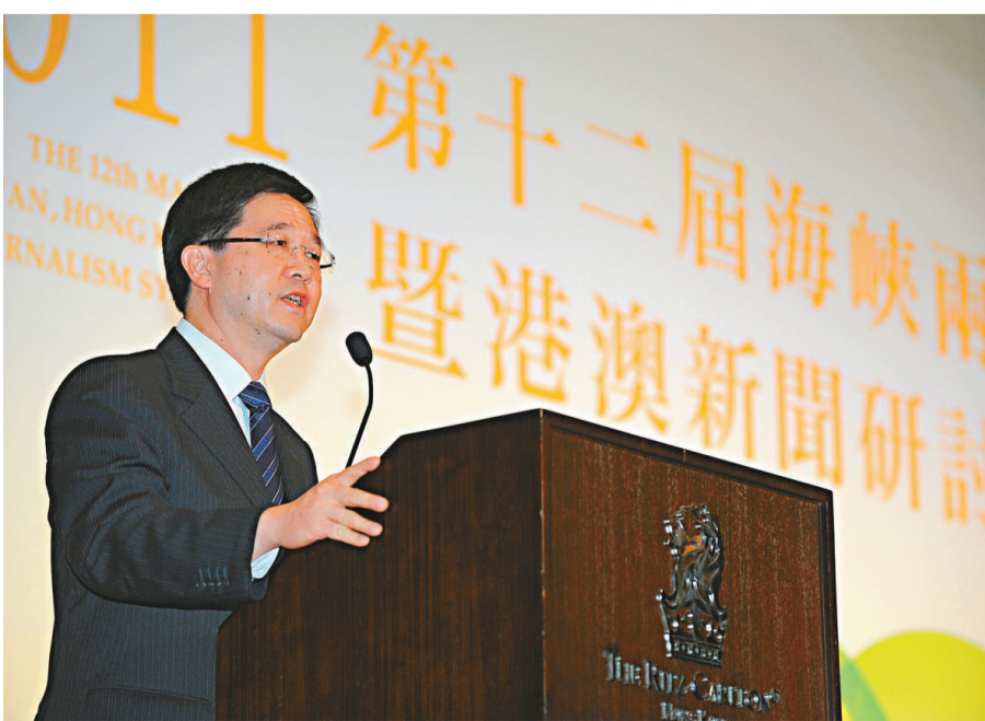
▲林瑞麟在研討會開幕禮上致辭

【本報訊】「第十二屆海峽兩岸暨港澳新聞研討會」昨日在香港麗思卡頓酒店舉行開幕典禮及歡迎晚宴，本屆主題為《傳媒面對新科技的挑戰與機遇》，並邀得署理行政長官林瑞麟主禮。林瑞麟期望兩岸四地媒體繼續為民眾謀福祉，不斷提升政府的透明度。