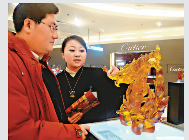
▲龍年尚未來到，來自台灣琉璃工房2012新龍琉璃藝術展攜北京故宮藏品搶先亮相山東濟南，五十多件以「龍」為主題的琉璃作品備受關注。

由於魏平祺曾代表所屬行業公開表態支持馬英九的ECFA政策，向來被視為是藍營在彰化地區及該行業的「重要樁腳」，加上鄭俊雄原屬國民黨籍，報導6日引發廣泛關注「綠拔藍樁」的問題。