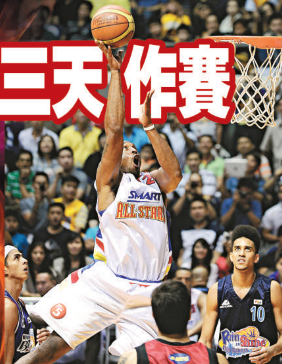
▲湖人高比拜仁(中)今夏遠赴德國進行膝蓋手術，坦言現時猶如重獲新生 ◀在羅斯的帶領下，公牛有望重拾昔日光輝